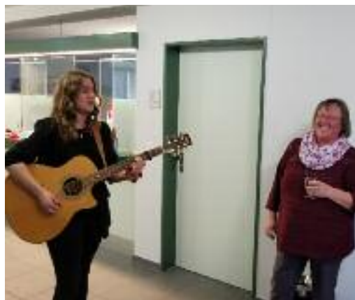
Überraschungsständchen für die Jubilarin