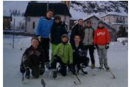
Auch neben der Piste wurde eifrig «gespörtelt»

Mit der «Hausputzete» geht am Freitagmorgen nach dem Frühstück die Lagerwoche im Haus zu Ende und der letzte Skitag bei schönstem Wetter beginnt. Zwei Leiter bleiben im Haus und helfen den Car zu beladen, der uns am Nachmittag direkt von Celerina wieder nach Tagelswangen bringt, über den Julierpass und vorbei am geschichtsträchtigen Marmoreraese.