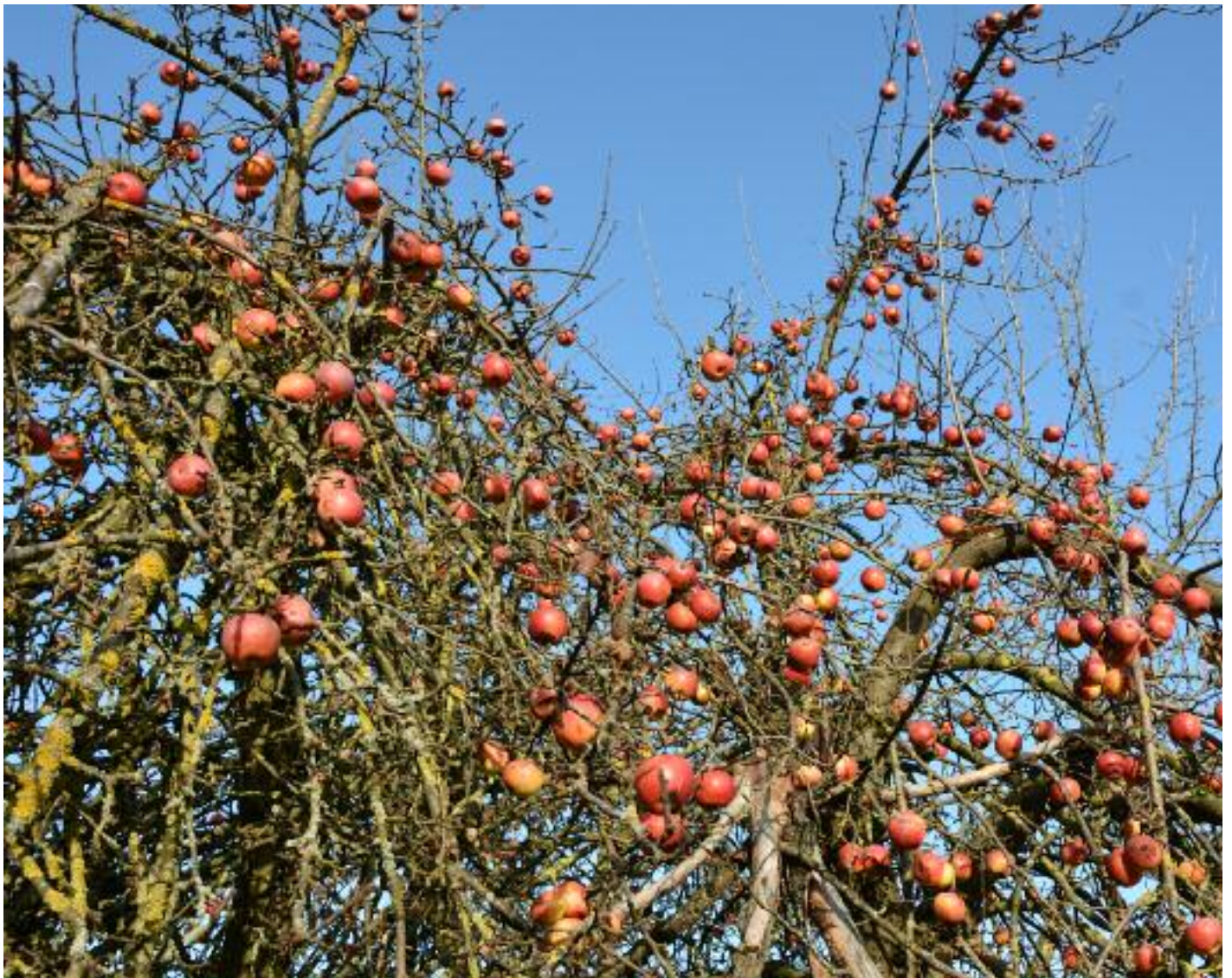
Sogar im Winter trägt dieser Apfelbaum noch Früchte aus dem vergangenen Jahr.