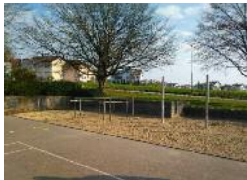
Die Sandanlage beim Schulhaus Bachwis

Die Spielflächen im Schulhaus Buck in Tagelswangen wurden bereits 2018 umfassend saniert und erweitert. Auch für das Schulhaus Bachwis in Winterberg machte sich eine Projektgruppe Gedanken über die Spielsituation auf ihrer Schulanlage. Dort befinden sich teilweise ältere Spielgeräte. Im Sandplatz mussten die Spielgeräte (Reck und Barren, Klettertürme usw.) schon öfters repariert werden. Das grosse Spielgerät (Kletterturm) muss aus statischen Gründen ersetzt werden.