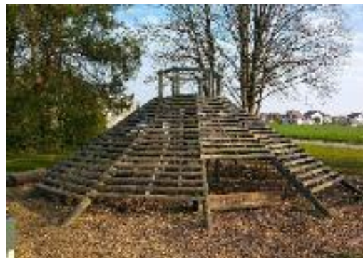
Der Kletterturm in Winterberg erfreut sich grosser Beliebtheit.

Auch die Attraktivität der bestehenden Geräte entspricht nicht mehr den Bedürfnissen der Kinder. Die Kinder können sich so nicht mehr richtig austoben. Das Projektteam hat das gesamte Areal der Schulanlage angeschaut und Ideen für die bestehenden und die noch freien Plätze gesammelt.