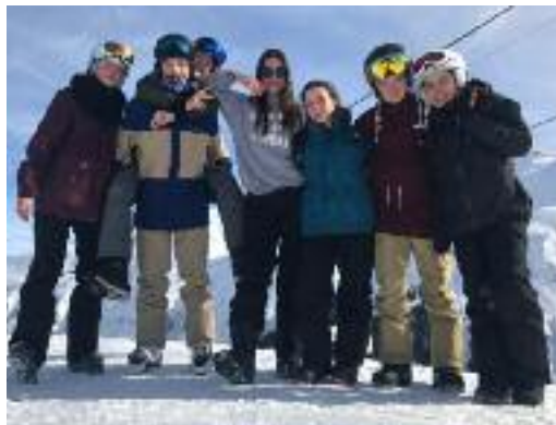
Die Oberstufe durfte bei herrlichem Skiwetter eine unvergessliche Woche erleben.

Wir trafen uns am Montag um 7 Uhr in Grafstal und traten, mit viel Gepäck beladen, die Carreise ins Ski-gebiet Sedrun-Andermatt an. Viele Jugendliche verschliefen den grössten Teil der Fahrt, die drei Stunden dauerte und vom Carunternehmen Nüssli bewältigt wurde. Als wir dann ankamen, packten wir unsere Skier und Boards und gingen voller Erwartungen in verschiedenen Gruppen und je einem Leiter auf die Piste. Den mitgebrachten Lunch assen wir wie jeden Tag um 12 Uhr an einem sonnigen Plätzchen. Meis-