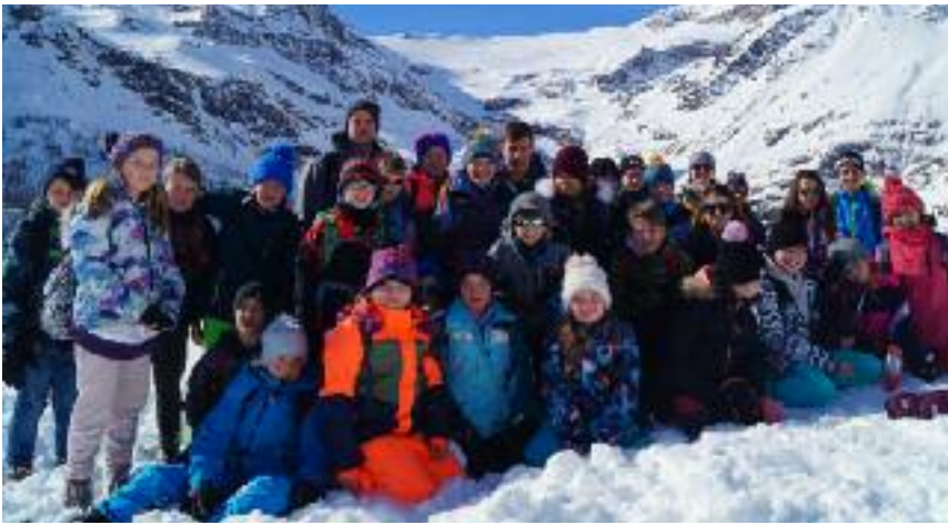
Prächtige Laune und unschlagbares Wetter prägten das Skilager im Engadin.

Der Mittwoch sticht wie jedes Jahr aus dem Skilageralltag heraus: Easy Day! Etwas länger schlafen und dann «Hotelfrühstück». Mit grosser Liebe haben unsere Küchenfeen ein Buffet hergezauert, das einem das Wasser im Mund zusammenlaufen lässt. Nachdem alle gemütlich gefrühstückt haben und unsere Ämtlis erledigt sind, starten wir unseren Mittwochsausflug. Wir fahren mit der RhB in Richtung Puschlav bis zur Alp Grüm. Dort geniessen wir einen kurzen Moment die prächtige Aussicht auf Poschiavo und im Schnee wird noch etwas herumgealbert. Dann geht es ab in die andere Richtung, nochmals am Morteratschgletscher vorbei bis nach Pontresina. Im Hallenbad erwarten sie uns schon und die drei Stunden Baden, Rutschen, Spielen, Chillen und Lunch essen gehen im Flug vorbei. Wieder in Wintermontur geht es zurück zum Bahnhof und die Rückfahrt nach S-chanf ist angesagt. Dort empfängt uns das Küchenteam 2.0 wieder herzlich und mit einem kleinen Zvieri.