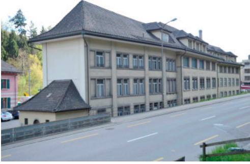
0608 Post- und Bürogebäude (Vers. Nr. 1231)