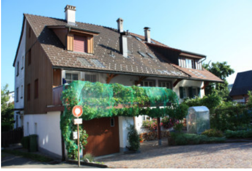
0643 Südliche Trauffassade