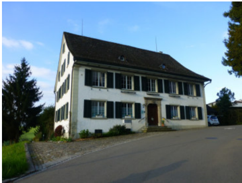
0429 Strassenseitige Trauffassade