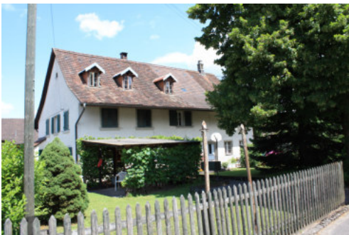
0673 Ansicht von Südwesten

Ob der in der Literatur (GUBLER 1978) erwähnte schablonierte Kachelofen aus der Zeit um 1800 erhalten ist, ist nicht bekannt.