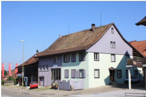
0652 Südliche Trauffassade