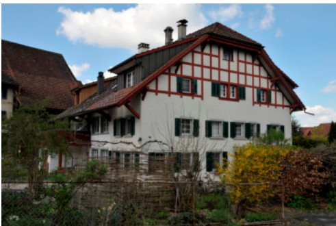
0240 Ansicht von Osten