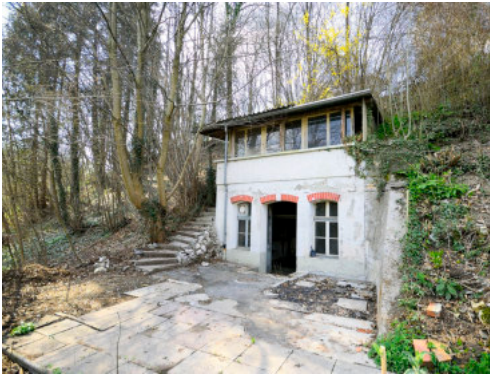
0693 Garten- und Waschhaus