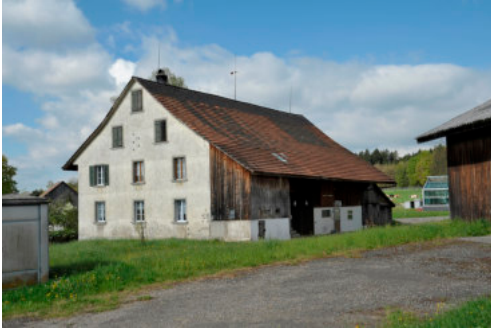
0526 Ansicht von Nordosten