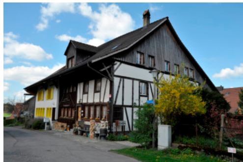
0252 Ansicht von Südosten