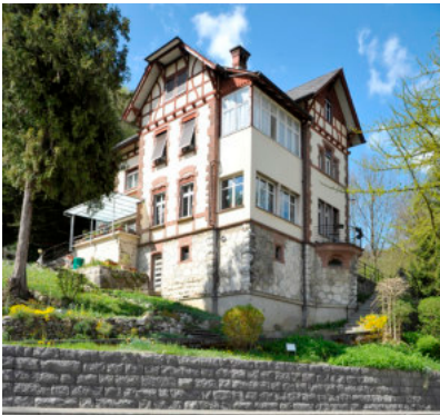
0615 Ansicht von Süden

Bautyp Wohnbau Bauzeit 1897 Architekt August Dietz