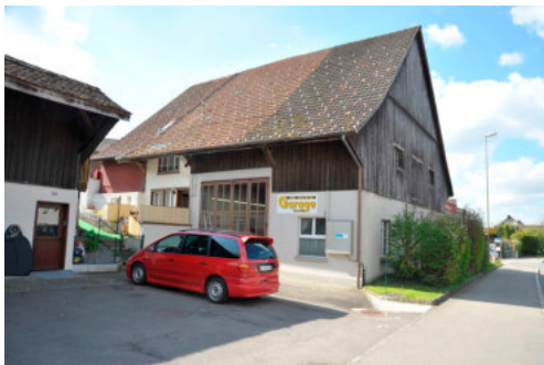
0182 Ansicht der östlichen Trauffassade