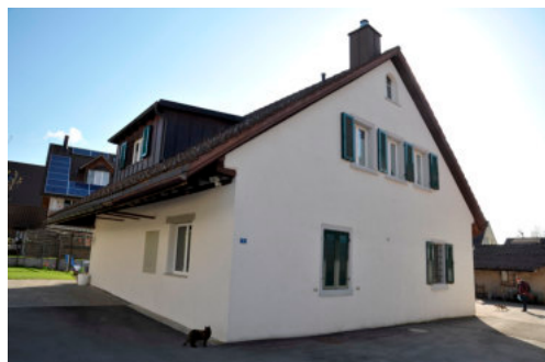
0065 Südwestliche Ansicht