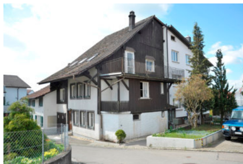
0212 Ansicht von Nordosten