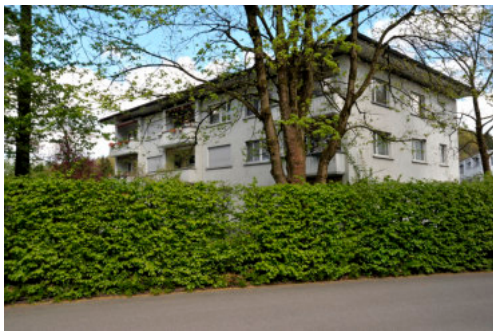
0555 Südliche Ansicht