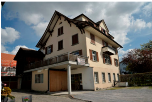
0236 Ansicht der Südwestfassade