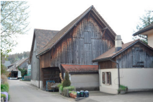
0228 Ansicht der westlichen Giebelfassade

Bautyp Landwirtschaftsbau - Wohnbau Bauzeit 1816 1834 Architekt