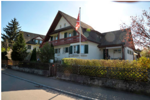
0392 Ansicht der Ostfassade