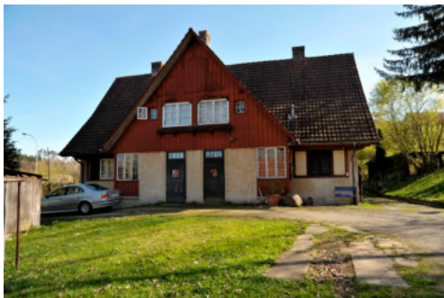
0425 Ansicht der Nordfassade