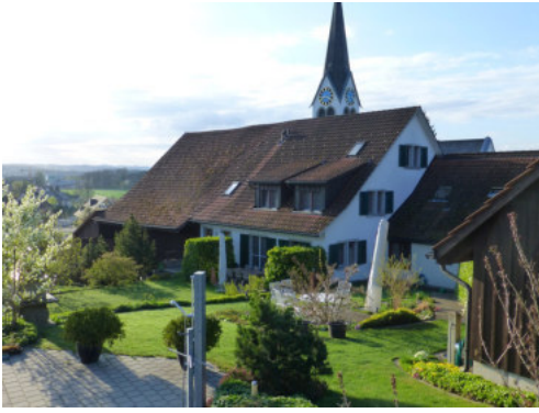
0459 Ansicht von Nordwesten