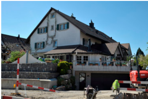
0343 Ansicht von Osten