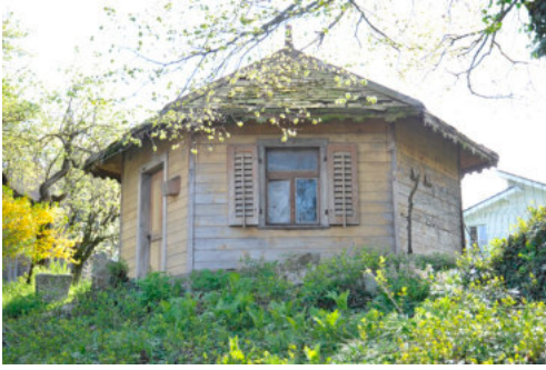
0103 Ansicht von Nordwesten.