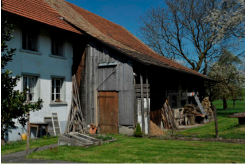
0306 Ansicht der südliche Trauffassade