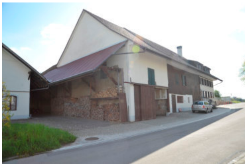
0145 Ansicht von Nordwesten