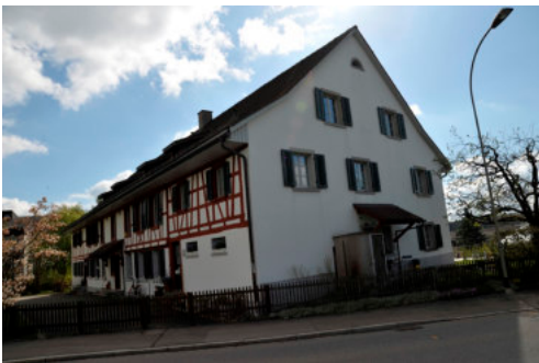
0519 Westliche Giebelfassade

Bautyp Wohnbau Bauzeit 1834, 1845 1897 Architekt