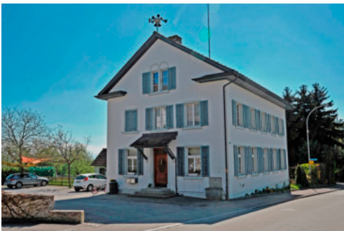
0329 Nördliche Giebelfassade