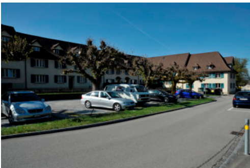
0379 Ansicht von Südosten