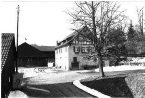
0681 Foto von 1982