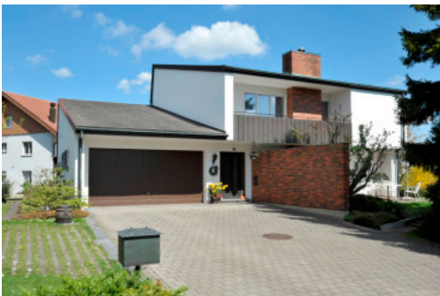
0285 Ansicht von Süden