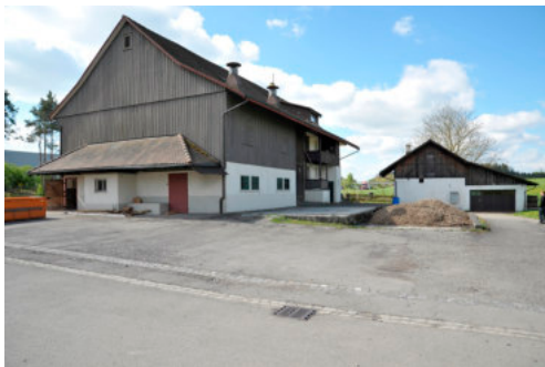
0539 Nordöstlichen Ansicht