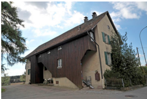
0514 Ansicht der Nordfassade

Bautyp Wohnbau Bauzeit 13. Jh. 15. Jh. Architekt