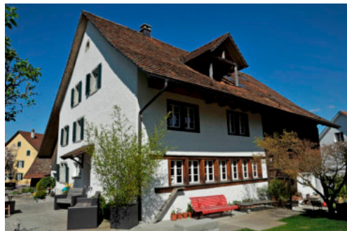
0340 Ansicht der südlichen Trauffassade