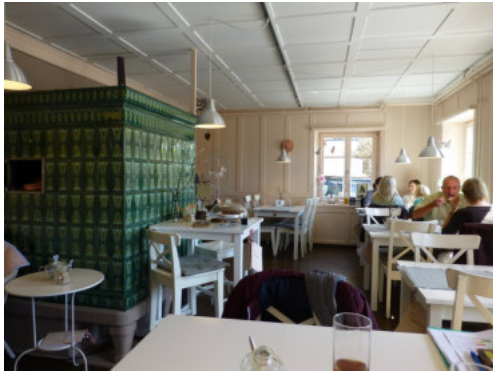
0491 Südliche Trauffassade