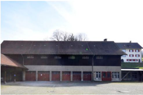
0690 Gutshof Magazin, Ansicht von Norden