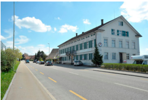
0271 Ansicht der Nordwestfassade

Das ehemalige Restaurant Landhaus zeugt mit den weiteren Bauten entlang der 1841 neu erstellten Zürcherstrasse von der Siedlungserweiterung Tagelswagens. Der parallel zum Trassee ausgerichtete und klassizistisch geprägte Baukörper besitzt eine prägende Wirkung für das westliche Ortsbild. Des Weiteren besitzt es mit seiner Nutzungsgeschichte eine sozialhistorische Zeugenschaft.