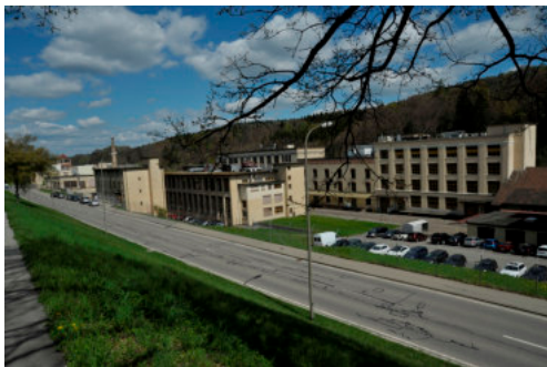
0583 Ansicht von Südwesten.