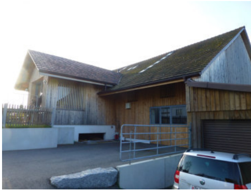
0441 Ansicht der Ökonomie von Nordwesten