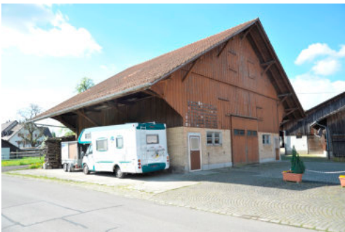
0156 Ansicht von Nordosten