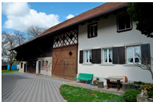
0213 Südliche Trauffassade

Bautyp Landwirtschaftsbau - Wohnbau Bauzeit 1827 1837 Architekt