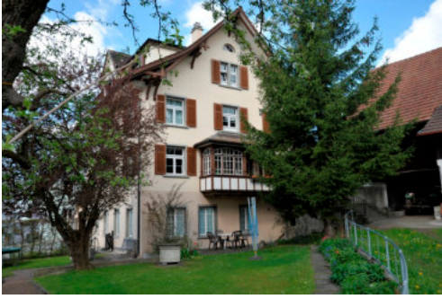
0238 Ansicht von Südosten mit dem Eingang