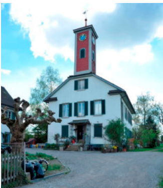
0262 Ansicht von Norden