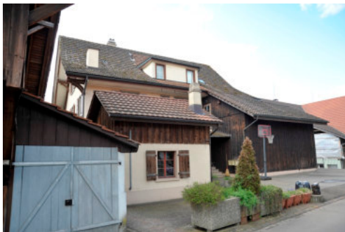
0225 Ansicht der Nordfassade