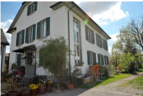
0266 Ansicht der westlichen Trauffassade