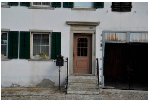
0235 Detail Hauseingang

Das traufständig zur Zürcherstrasse orientierte Vielweckbauernhaus "Zur frohen Aussicht" überzeugt durch den authentisch erhaltenen Wohnteil, welcher dem Spätklassizismus verpflichtet ist. Die Querzone des Tennis wurde im Verlauf der 2. Hälfte des 20. Jahrhunderts unsachgemäss zu Wohnzwecken und einer Garage ausgebaut – ansonsten zeigt sich der Bau äusserlich wenig verändert. Mit seinem spätklassizistischen Äusseren zählt das Vielweckbauernhaus Zürcherstrasse 50 wie auch Zürcherstrasse 57 und das Restaurant Landhaus zu den repräsentativen Neubauten an der kurz zuvor (1842) neu angelegten Staatsstrasse. Sehr hohe Bedeutung im Ortsbild am Ortseingang.