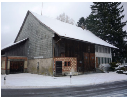
0629 Ansicht von Südwesten

Bautyp Landwirtschaftsbau - Wohnbau Bauzeit 1869 1876 Architekt