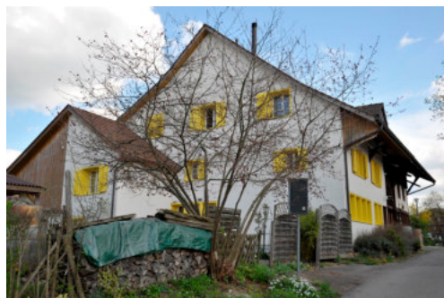
0256 Ansicht der westlichen Giebelfassade

Bautyp Landwirtschaftsbau - Wohnbau Bauzeit 1516 Architekt