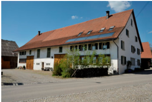
0322 Ansicht von Süden