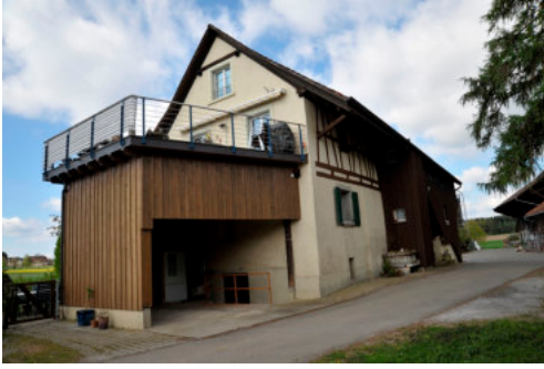
0515 Nordost Ansicht