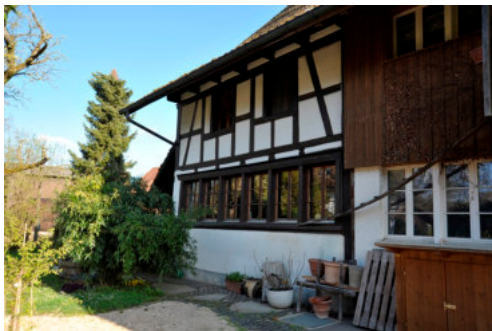
0048 Wohnteil von Süden

Bautyp Landwirtschaftsbau - Wohnbau Bauzeit 1818 Architekt