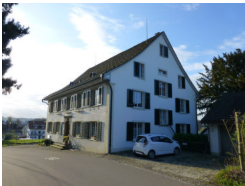
0433 Nordwest Ansicht

Sehr authentisch erhaltenes Pfarrhaus aus der 2. Hälfte des 18. Jahrhunderts. Durch seine Lage vis à vis der Kirche und erhöht über dem Dorfplatz besitzt es einen herausragenden Situationswert. Obschon das Gebäude im Innern Veränderungen erfahren hat, hat sich das Gesamtbild bis heute erhalten.