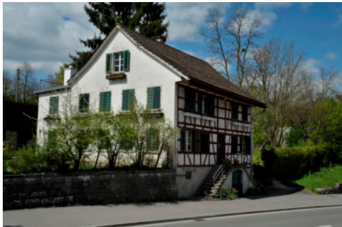
0579 Ansicht von Süden