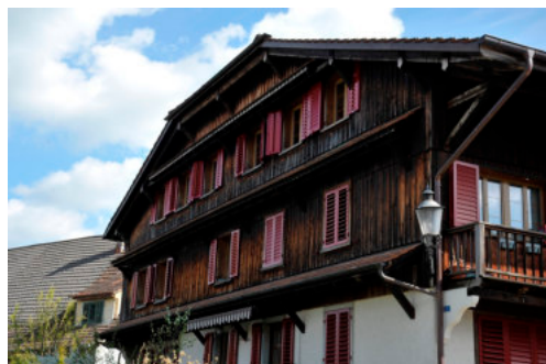
0174 Detail der Westfassade