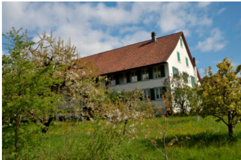
0535 Ansicht von Südwesten.