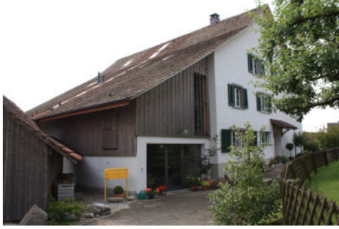
0684 Westliche Giebelfassade