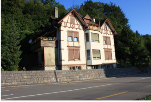
0666 Östliche Hauptfassade