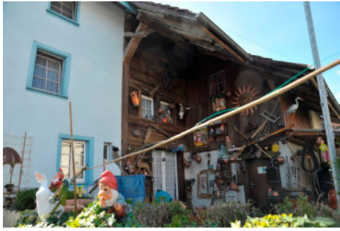
0140 Ansicht Nordfassade Vers. Nr. 696.