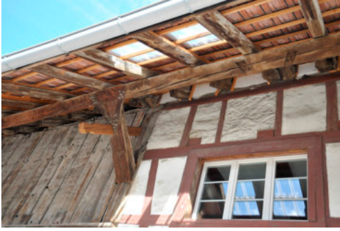
0191 Detail der Vordachkonstruktion