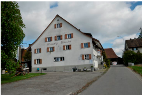
0500 Ansicht der südlichen Giebelfassade