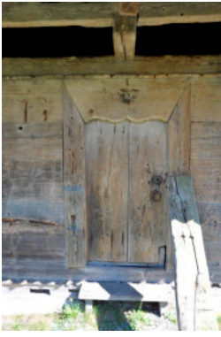
0357 Ansicht des Eingangs