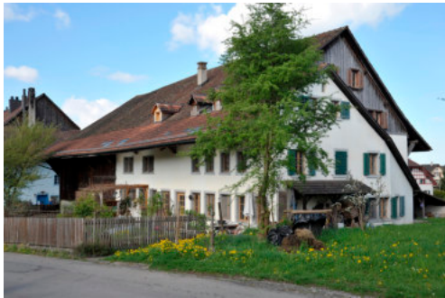
0106 Ansicht von Südosten