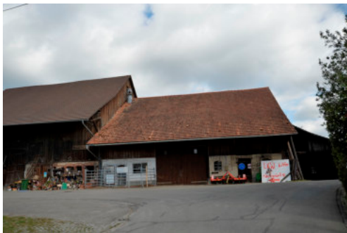
0502 Ansicht der kleinen Scheune von Süden

Bautyp Landwirtschaftsbau Bauzeit 2. H. 19. Jh./1920er Architekt