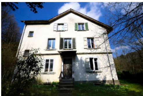
0694 Ansicht der Südfassade

Wohnhaus von 1879 mit Holzschopf, Geflügelhaus, Gartenhaus und Ökonomie, welches ab 1885 im Eigentum von Julius Maggi war.