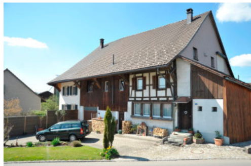
0308 Ansicht von Südosten