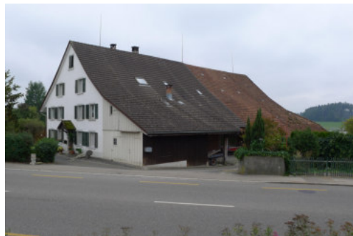
Ansicht von Nordwesten

Bautyp Landwirtschaftsbau - Wohnbau Bauzeit 1844;1865;1901 Architekt