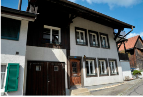
0207 Ansicht der Ostfassade Alter Kirchweg 3