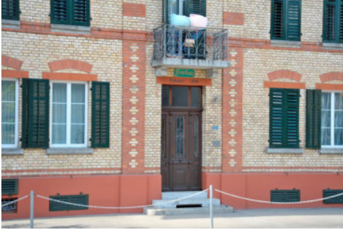
0570 Detail der Eingangssituation