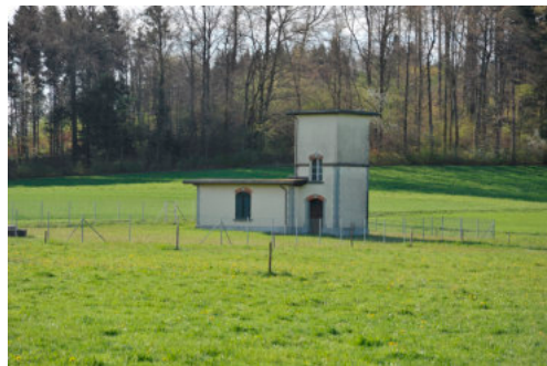
0051 Ansicht von Norden