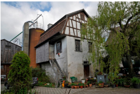
0512 Ansicht von Süden