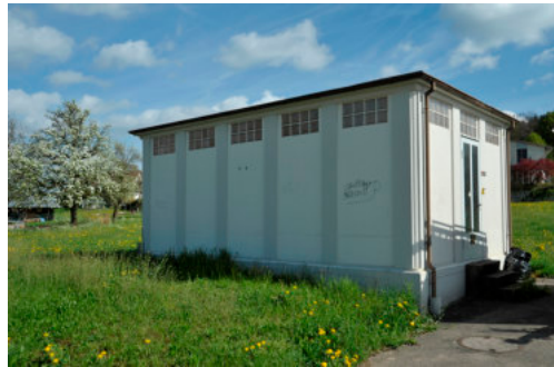
0159 Ansicht von Südwesten

Weitere Inventare ISOS KGS ISOS = Bundesinventar der schützenswerten Ortsbilder der Schweiz von nationaler Bedeutung (Bundesamt für Kultur) KGS = Schweizerisches Inventar der Kulturgüter von nationaler (und regionaler) Bedeutung (Bundesamt für Bevölkerungsschutz)