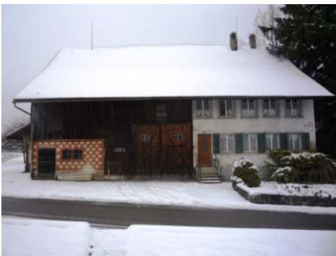
0631 Ansicht von Süden