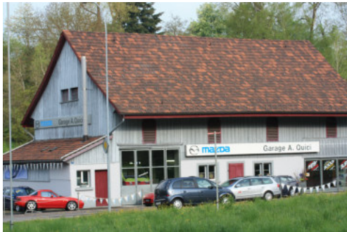
0679 Ansicht von Osten.