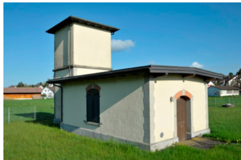
0052 Ansicht von Süden