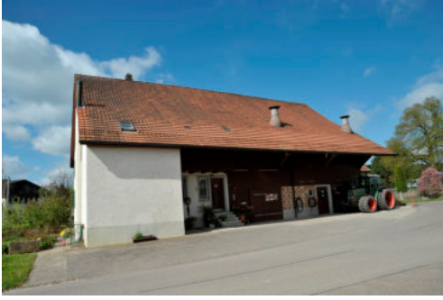
0529 Ansicht von Osten.