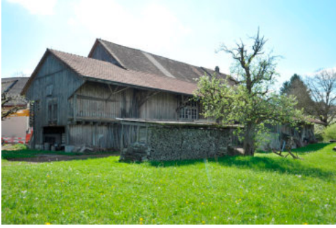
0281 Nördliche Trauffassade