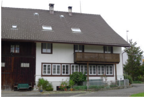
Ansicht des Wohnteils von Osten