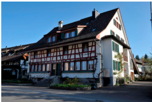
0035 Ansicht der Südfassade