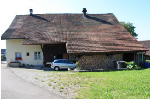
0649 Nördliche Trauffassade