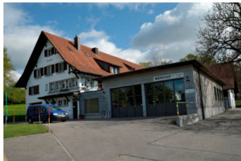
0498 Ansicht von Süden

Bautyp Verkehrs- und Infrastrukturbau Bauzeit 1929 1930 Architekt