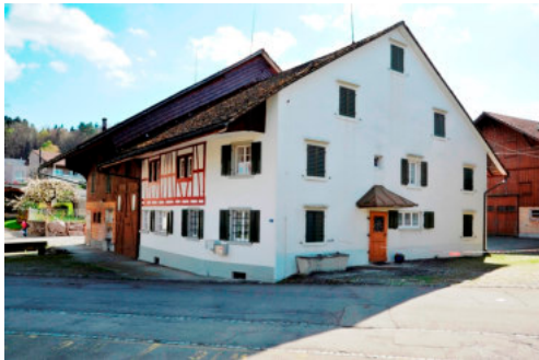
0150 Ansicht der westlichen Giebelfassade

Bautyp Landwirtschaftsbau - Wohnbau Bauzeit <1812 Architekt