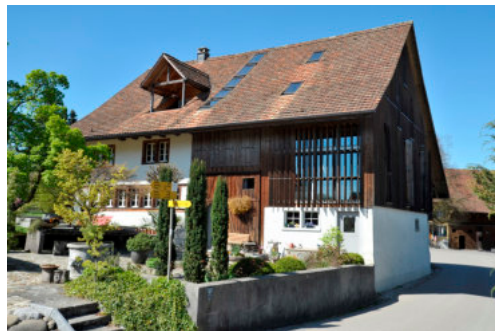
0341 Ansicht der südlichen Trauffassade