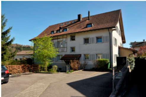
0397 Ansicht der Nordfassade