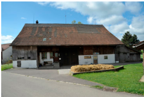
0527 Ansicht von Norden