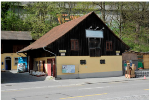
0605 Nebengebäude von Osten

Ehemalige Hammermühle bzw. Kupferschmiede, welche in der Mitte des 19. Jahrhunderts im Tal erstellt wurde. Verschiedenste Nutzungen haben die Gebäude geprägt, bis sie 1862 von Michael Maggi gekauft und in eine Mühle umgebaut wurden. Das Ensemble steht für den Anfang des erfolgreichen Unternehmens Maggi.