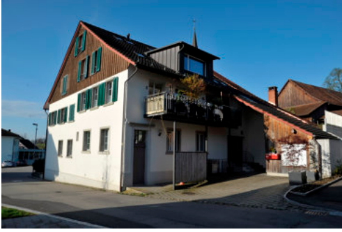
0012 Ansicht von Nordsoten