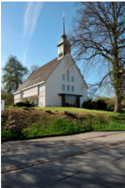
0410 Ansicht von Osten