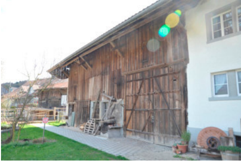
0258 Nordfassade der Ökonomie-Trauffassade