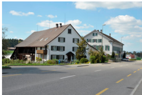
0268 Ansicht von Nordosten