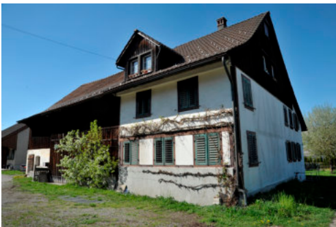
0363 Südliche Trauffassade mit dem Wohnteil