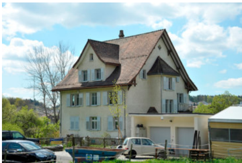
0565 Ansicht von Nordosten