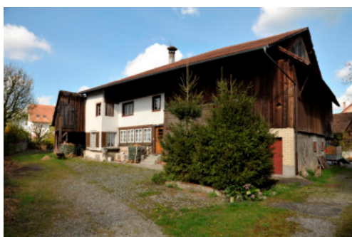
0130 Ansicht von Süden