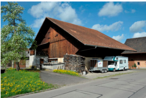
0158 Ansicht von Südosten

Bautyp Landwirtschaftsbau Bauzeit 1928 Architekt