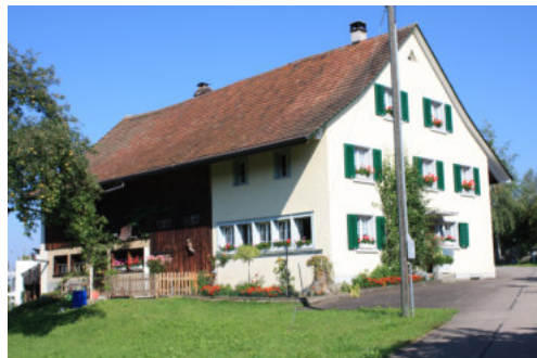
0648 Ansicht von Südosten