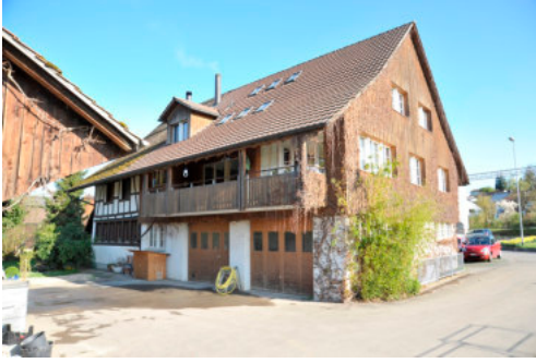
0047 Südöstliche Ansicht