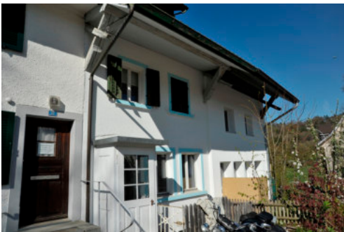
0400 Südansicht von Dorfstrasse 16/18

Es wird empfohlen, die Schutzwürdigkeit genau abzuklären.