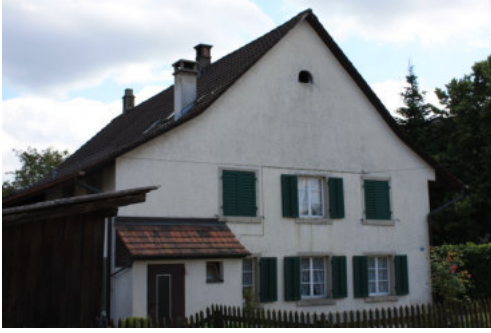
0672 Ansicht der westlichen Giebelfassade