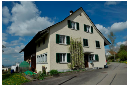
0220 Östliche Giebelfassade

Bautyp Landwirtschaftsbau - Wohnbau Bauzeit 1823 Architekt