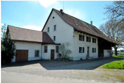
0297 Nordwestliche Ansicht