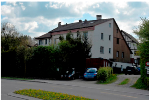
0237 Ansicht von Norden

Bautyp Wohnbau Bauzeit 16. Jh. Architekt