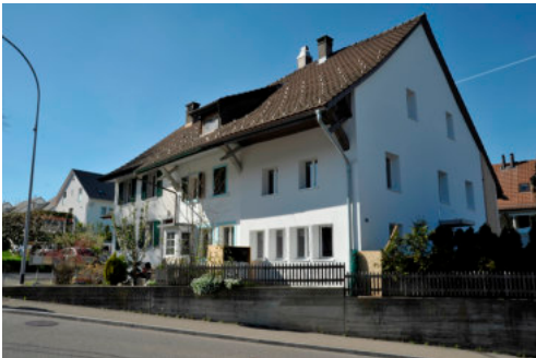
0399 Ansicht von Südosten

Bautyp Wohnbau Bauzeit vor 1812 Architekt