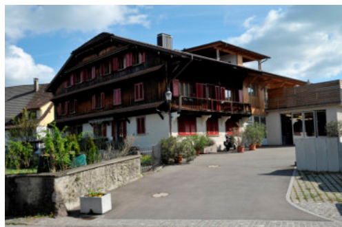
0172 Ansicht von Westen