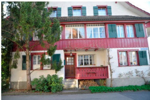
0034 Westliche Giebelfassade