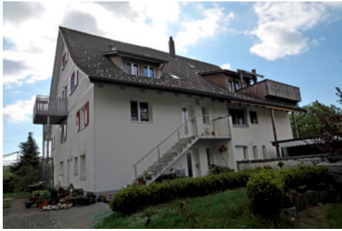
0511 Ansicht der westlichen Trauffassade