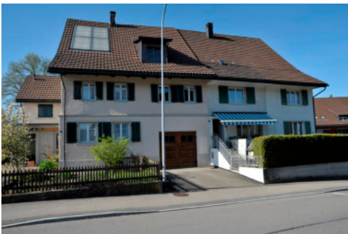
0415 Ansicht der Südfassade