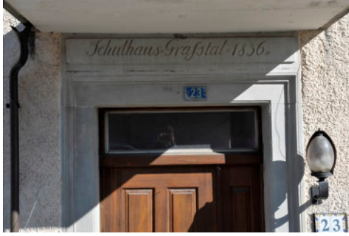
0405 Türportal in der westlichen Giebelfassade