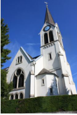
0633 Ansicht von Süden