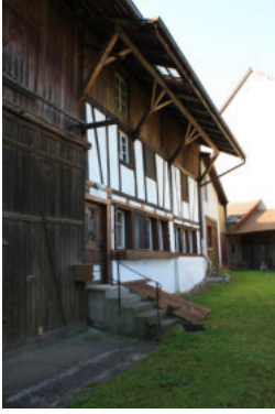
0646 Ansicht des nördlichen Wohnteils