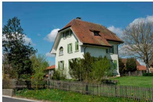
0273 Ansicht von Süden