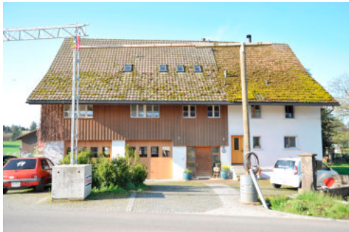
0046 Nördliche Trauffassade