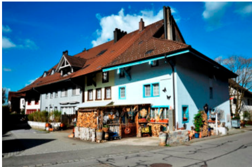
0110 Ansicht der südöstlichen Trauffassade