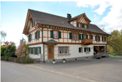
0558 Ansicht von Norden