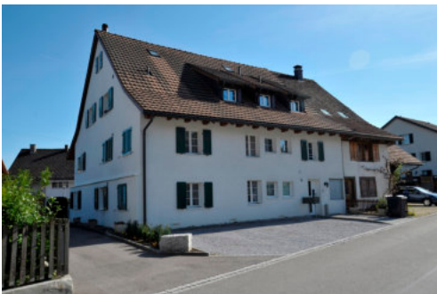
0416 Ansicht von Nordosten