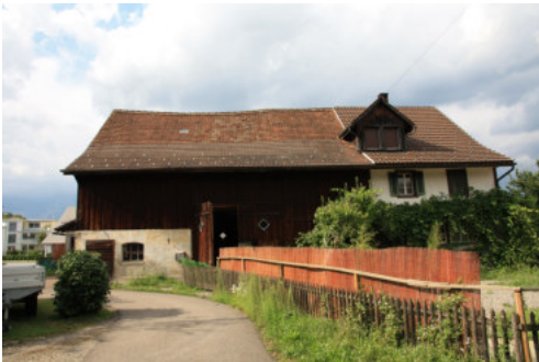
0674 Südliche Trauffassade