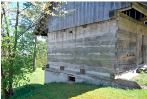
0358 Detail des Blockgefüges mit verzinktem

Der aus dem 16. Jahrhundert stammende Speicherbau stellt mit seiner speziellen Konstruktion und der hochstehenden Zimmermannsarbeit einen wichtigen konstruktionsgeschichtlichen Zeugen in Winterberg dar. Er ist der einzige erhaltene von ursprünglich sechs Speicherbauten in Winterberg.