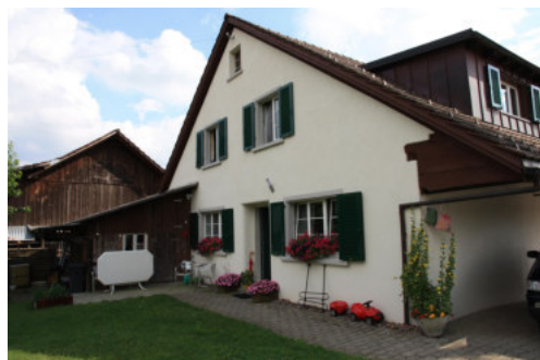
0660 Ansicht von Norden