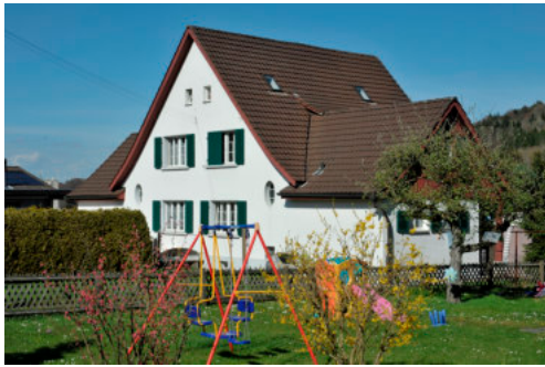
0390 Ansicht von Westen