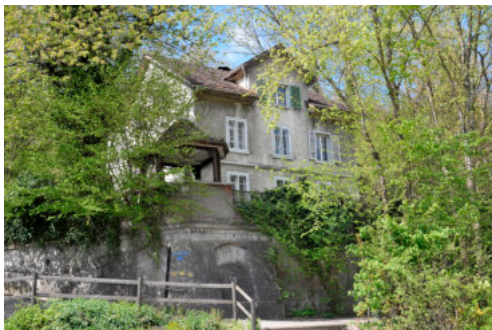
0597 Ansicht von Osten