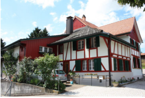
0677 Ansicht von Osten