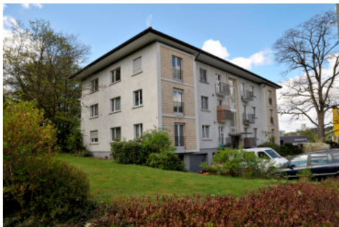
0553 Ansicht von Osten