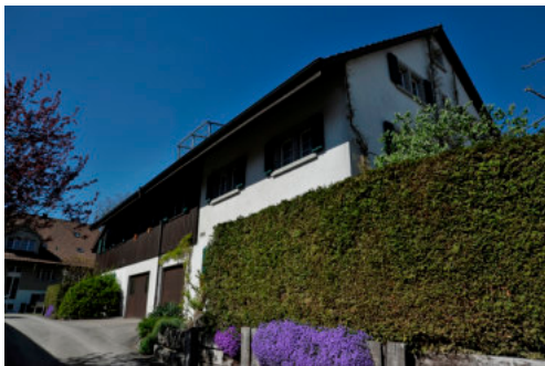
0347 Ansicht der Südfassade