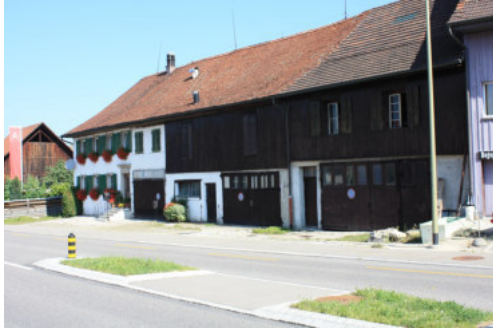
0654 Südliche Trauffassade