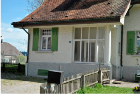
0275 Hauseingangssituation im Osten