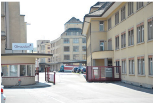
0625 Silogebäude im Hintergrund (Vers. Nr.)