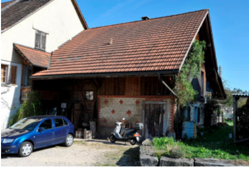
0418 Scheunenanbau von Dorfstrasse 35.