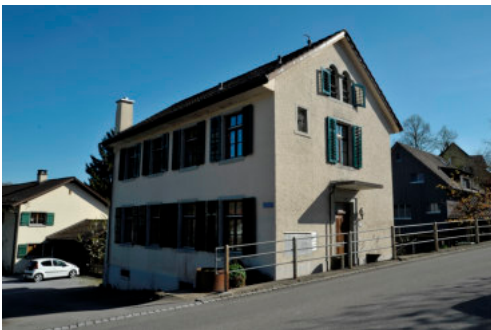
0404 Nordwestliche Ansicht