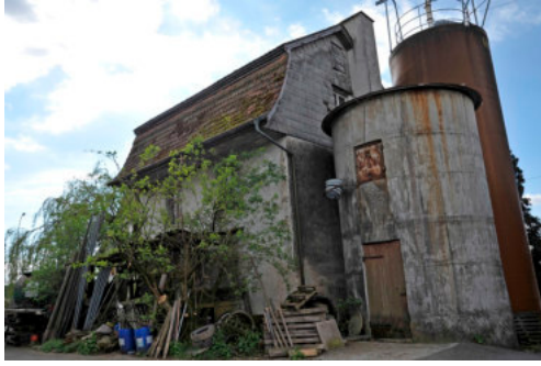
0507 Ansicht von Nordwesten