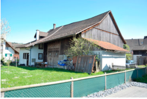
0362 Ansicht von Nordwesten