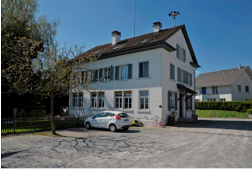
0332 Östliche Trauffassade