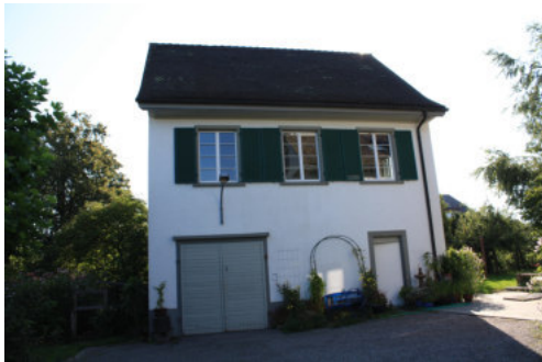
0642 Ansicht von Südwesten