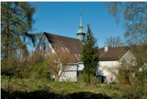
0412 Ansicht von Westen

Aussergewöhnlicher Sakralbau, welcher mit seiner Zweigeschossigkeit als gesellschaftlicher Mehrzweckbau fungiert. Die sachliche Fassadengestaltung zeigt die damals zeitgenössische architektonische Tendenz für einen neuen Kirchenbau.