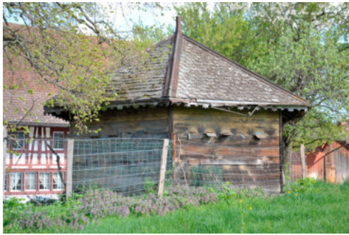
0104 Südwestansicht mit den Anflugbrettern

Bautyp Landwirtschaftsbau Bauzeit 1906 Architekt