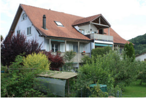
0678 Ansicht der Südfassade