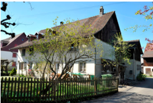
0365 Ansicht von Südosten