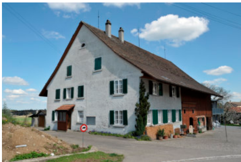
0291 Ansicht der westlichen Giebelfassade

Bautyp Landwirtschaftsbau - Wohnbau Bauzeit 1826 Architekt