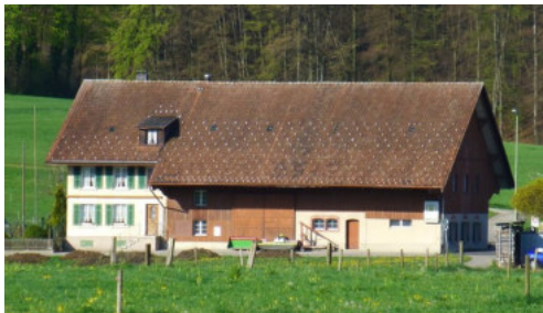
0471 Ansicht von Osten

Diskret verputztes Vielzweckbauernhaus mit historisierender Laubsägeornamentik im Schweizerhaus-Stil. Typologisch gutes Beispiel für den Wandel des dreiraumtiefen Grundrisses mit der rückseitigen Platzierung der Küche, anstatt in der mittleren Querzone.