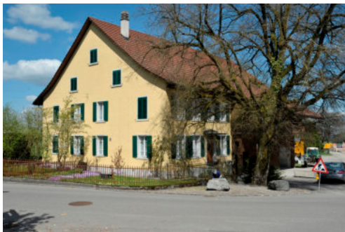
0287 Westliche Giebelfassade