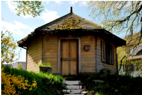
0100 Nordansicht mit dem Eingang