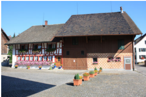
0645 Ansicht der südlichen Trauffassade