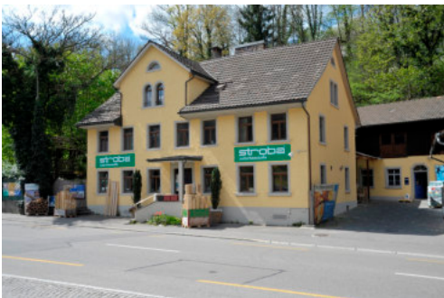
0604 Ansicht von Osten

Bautyp Wohnbau mit Gewerbenutzung Bauzeit 1848, 1910 Architekt