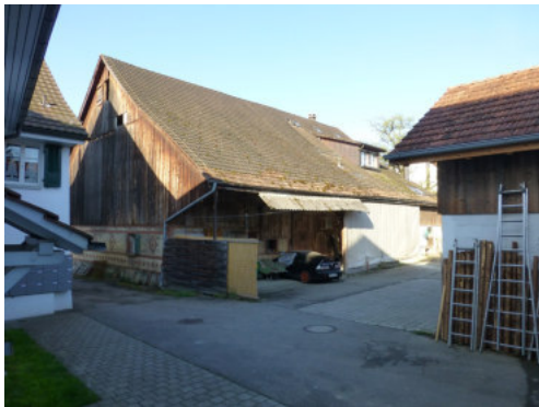
0467 Ansicht der Nordfassade

Bautyp Landwirtschaftsbau - Wohnbau Bauzeit 18. Jh. 1857 Architekt