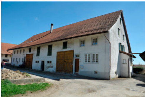
0323 Ansicht der nördlichen Trauffassade

Bautyp Landwirtschaftsbau - Wohnbau Bauzeit 1813 1876 Architekt