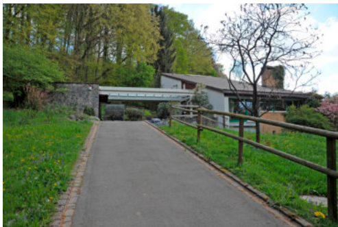
0545 Verbindungsbaus mit dem Wohnhaus