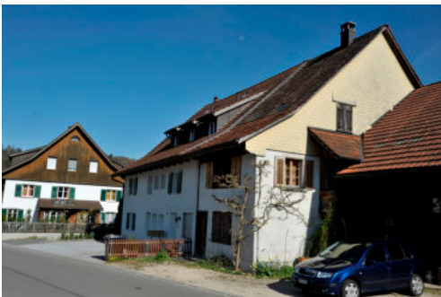
0417 Ansicht von Nordwesten