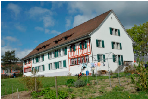
0518 Südliche Trauffassade