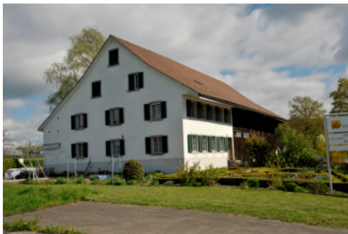
0520 Südwestliche Giebelfassade