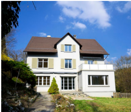
0692 Ansicht von Südwesten