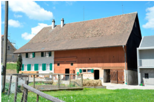
0288 Ansicht von Süden