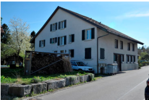
0419 Ansicht von Nordosten.

Bautyp Wohnbau Bauzeit vor 1812 Architekt