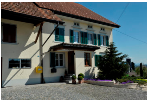
0324 Ansicht des Wohnteil in der Westfassade

Bautyp Landwirtschaftsbau - Wohnbau Bauzeit 1866 1875 Architekt