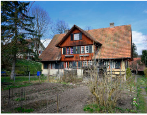
0698 Ansicht der Südfassade