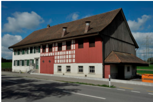
0538 Südliche Trauffassade