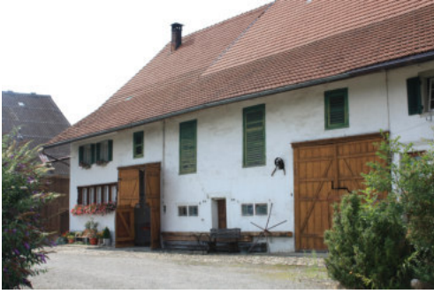
0655 Ansicht der südlichen Trauffassade