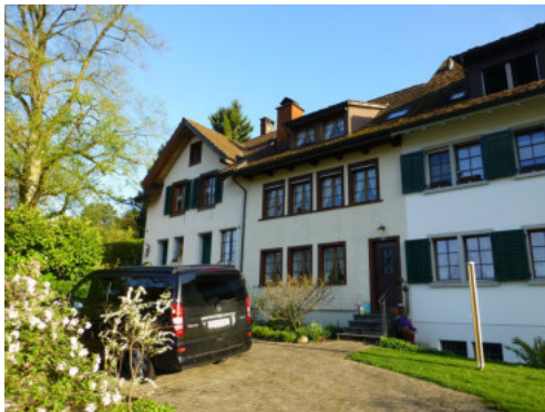
0455 Ansicht des westlichen Wohnteil von Süden

Bautyp Wohnbau Bauzeit 1818, 1822, 1876 Architekt