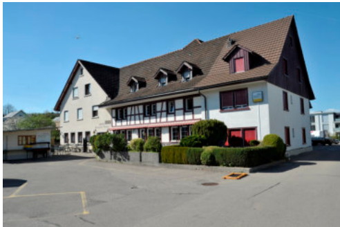
0366 Südliche Trauffassade