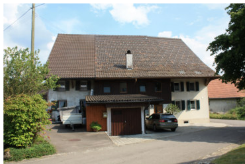
0656 Ansicht der nördlichen Trauffassade