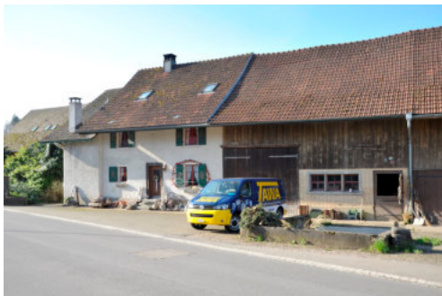
0036 Nördliche Trauffassade