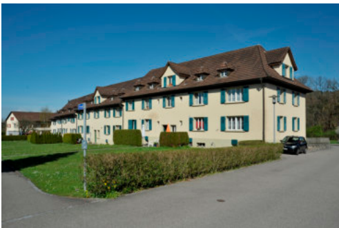
0378 Ansicht von Südwesten