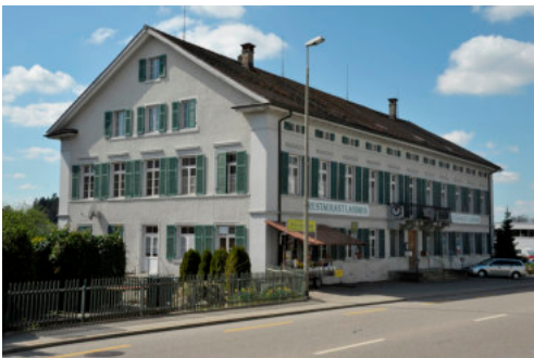
0269 Ansicht der Nordostfassade