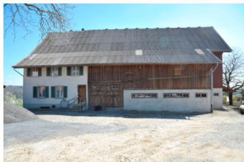
0348 Ansicht der nordwestlichen Trauffassade