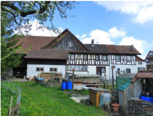
0481 Ansicht der Südfassade