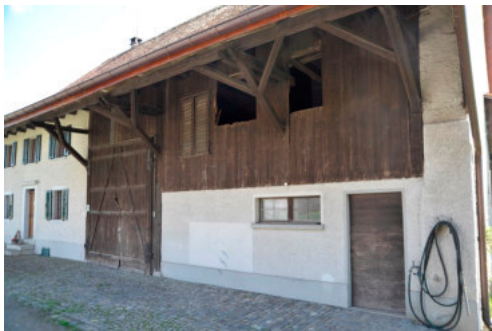
0299 Ansicht der Ökonomie von Nordwesten

Bautyp Landwirtschaftsbau - Wohnbau Bauzeit 1824 ~1890 Architekt