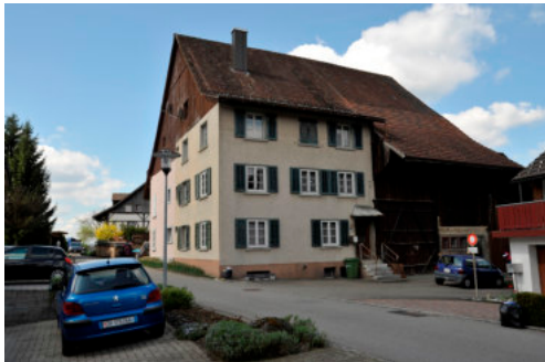
0242 Ansicht Alte Schulstrasse 4 von Osten