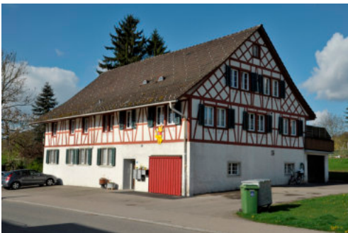
0078 Ansicht der östlichen Trauffassade