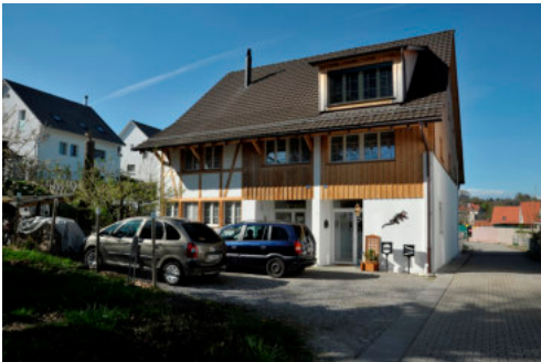
0403 Ansicht der Südfassade