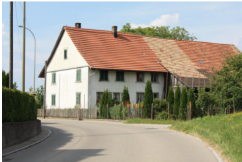
0658 Ansicht von Südwesten