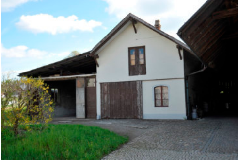
0146 Östliche Ansicht des Waschhausanbaus