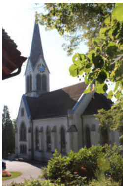
0635 Ansicht von Nordwesten