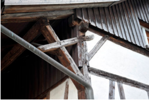
0253 Detail Vordachkonstruktion