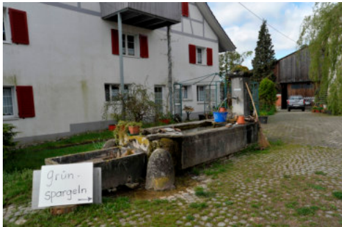
0503 Ansicht von Norden

Bautyp Verkehrs- und Infrastrukturbau Bauzeit 1818 Architekt