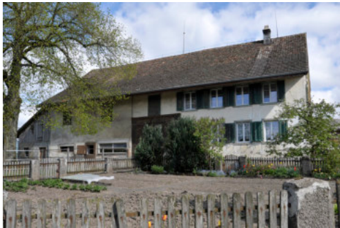
0532b Ansicht von Süden