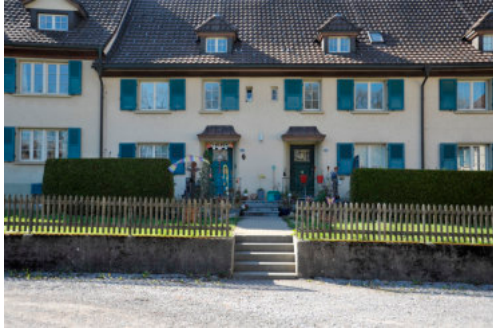
0381 Ansicht von Osten an eine Wohneinheit