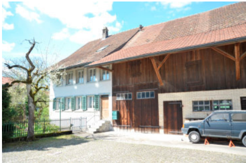
0278 Ansicht von Südosten