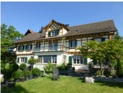
0702 Ansicht von Süden

Bautyp Landwirtschaftsbau - Wohnbau Bauzeit 1940 Architekt