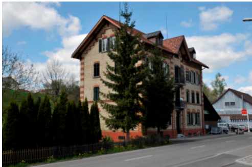
0569 Ansicht von Süden

Bautyp Wohnbau Bauzeit 1894 1896 Architekt