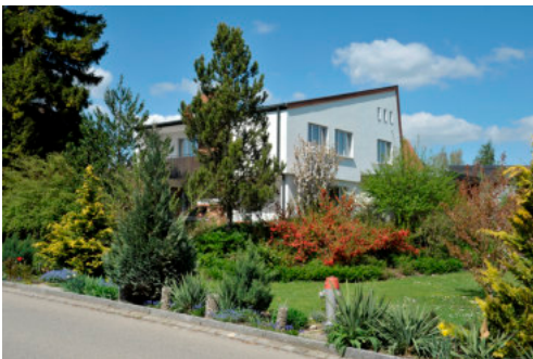
0284 Ansicht von Südosten