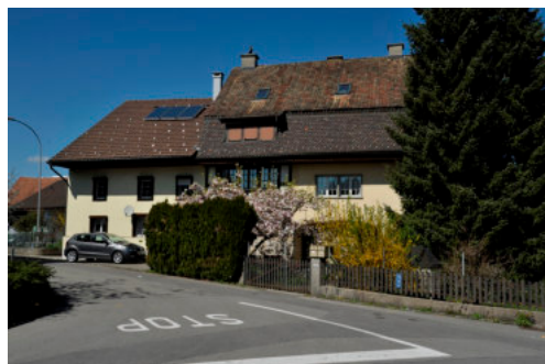
0333 Ansicht von Süden