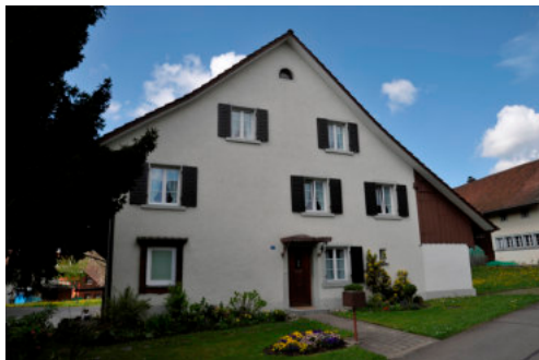
0216 Östliche Giebelfassade