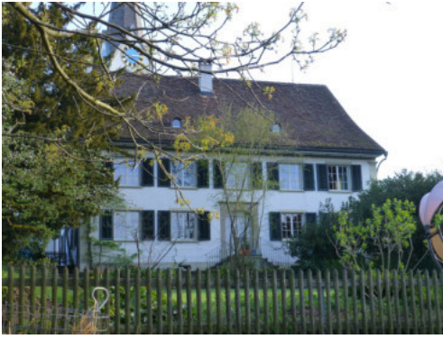
0451 Gartenseitige Trauffassade