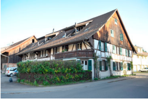
0027 Ansicht von Südosten