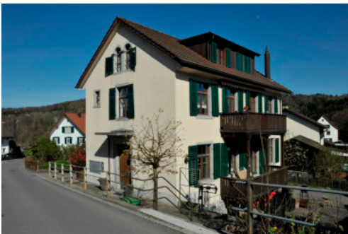
0406 Südwestliche Ansicht

Bautyp Bildungs- und Sporteinrichtung Bauzeit 1836 Architekt Heinrich Schmid