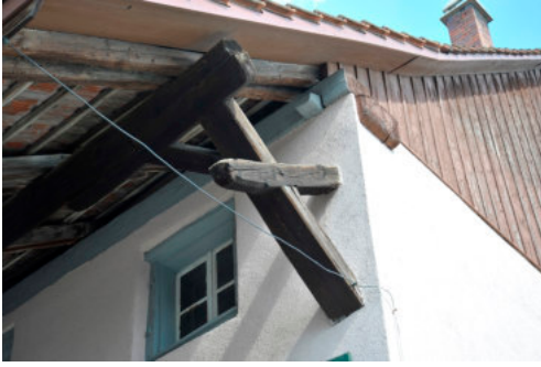
0247 Detail Alte Schulstrasse 6