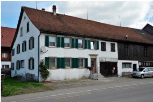
0234 Ansicht von Südwesten

Bautyp Landwirtschaftsbau - Wohnbau Bauzeit 1845 Architekt