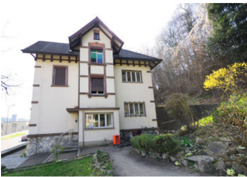
0695 Ansicht der Nordfassade