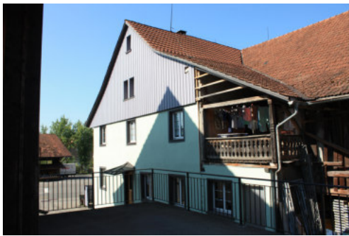
0651 Östliche Giebelfassade

Bautyp Landwirtschaftsbau - Wohnbau Bauzeit 1839 1917 Architekt