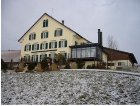
0636 Ansicht der südlichen Giebelfassade