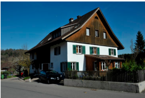
0414 Ansicht der westlichen Giebelfassade

Bautyp Wohnbau Bauzeit <1812; 1930er Jahre Architekt