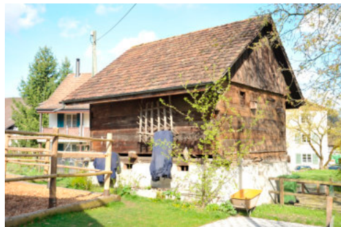
0131 Südliche Trauffassade