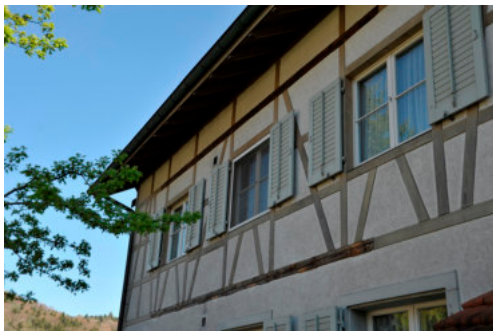
0398 Detail der Nordfassade

Neubau von 1987. Es wird empfohlen, die Schutzwürdigkeit genau abzuklären.