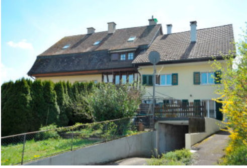
0290 Ansicht von Norden