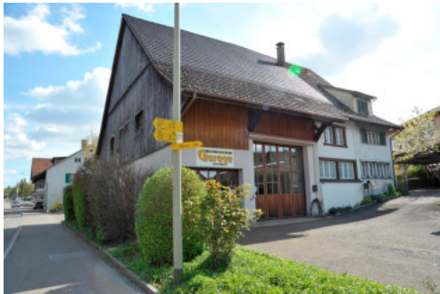
0181 Ansicht der westlichen Trauffassade