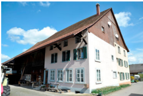
0246 Ansicht Alte Schulstrasse 6 von Westen