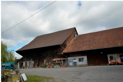
0501 Ansicht der grossen Scheune von Süden