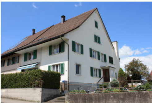
0671 Ansicht von Osten an Dorfstrasse 26