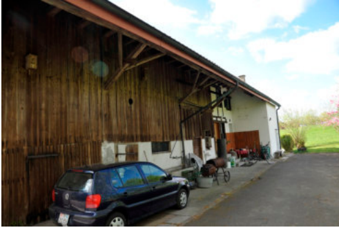
0523 Nordwestliche Trauffassade