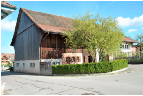
0109 Ansicht von Südwesten

Bautyp Landwirtschaftsbau - Wohnbau Bauzeit 1615 d 1791 Architekt