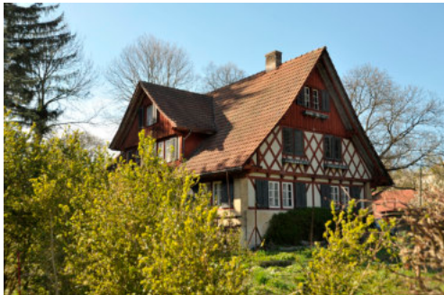
0424 Ansicht der Ostfassade