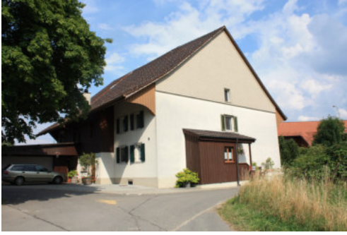
0657 Ansicht der westlichen Giebelfassade