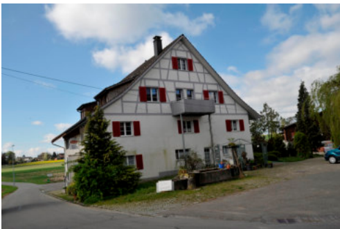
0504 Ansicht der nördlichen Giebelfassade

Bautyp Wohnbau mit Gewerbenutzung Bauzeit 18. Jh. Architekt