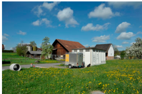
0160 Ansicht von Süden

Architektonisch bemerkenswerter Transformatorenhaus aus der 2. Hälfte des 20. Jahrhunderts. Filigrane Lisenen gliedern den schlichten Kleinbau mit elegant auskragendem Flachdach und verleihen dem Nutzbau eine gewisse Ausstrahlung.