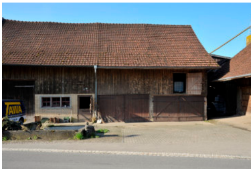
0037 Nördliche Trauffassade der Ökonomie