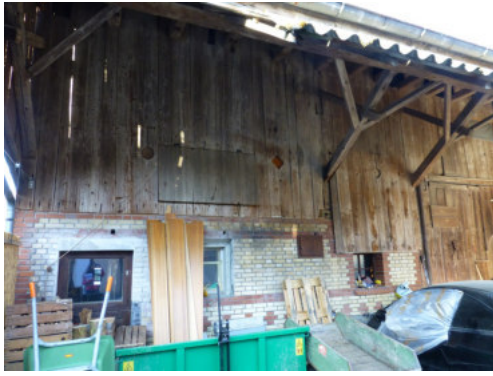
0468 Stalleinbau nördliche Trauffassade