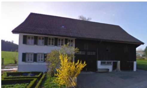
0640 Südöstliche Trauffassade