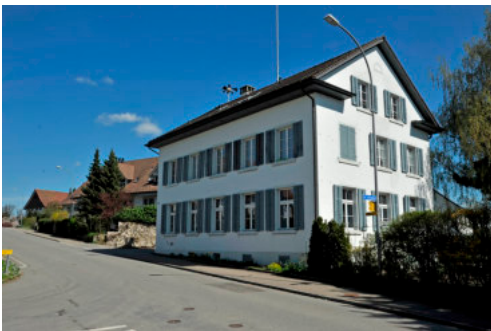
0328 Westliche Trauffassade

Bautyp Bildungs- und Sporteinrichtung Bauzeit 1863 Architekt Zimmermeister Kuhn, Rikon