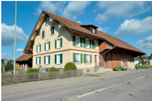
0083 Ansicht von Süden