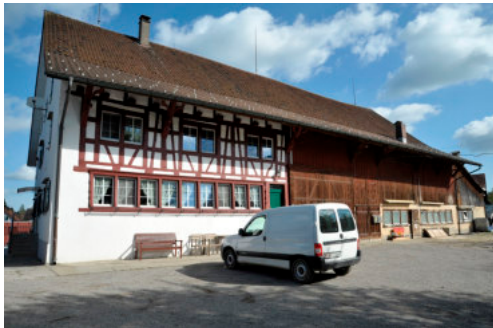
0095 Ansicht von Süden