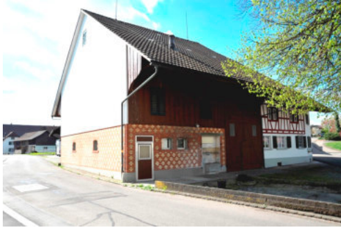
0153 Ansicht der nördlichen Scheunenfassade