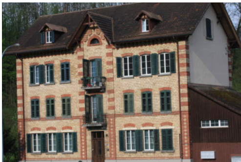
0680 Ansicht der Ostfassade

Das alte Kosthaus der Firma Maggi ist ein beeindruckender Sichtbacksteinbau mit polychromen Backsteinen, welche auf monumentale Elemente verweisen. Insgesamt sehr gut erhalten.