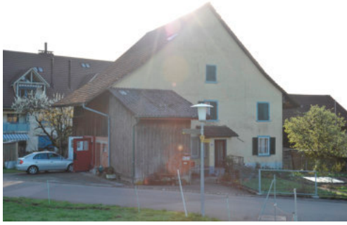
0019 Ansicht der westlichen Giebelfassade