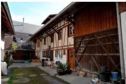
0203 Ansicht der nördlichen Trauffassade

Bautyp Landwirtschaftsbau - Wohnbau Bauzeit 164(?);1834; 19. Jh 1834 Architekt