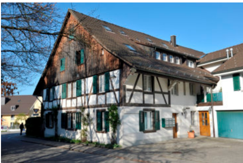
0025 Ansicht von Nordosten

Der traufständig zur Neuhofstrasse ausgerichtete Bau ist trotz des veränderten Äusseren wichtig für das Ortsbild von Lindau. Es wird empfohlen, die Schutzwürdigkeit genau abzuklären.