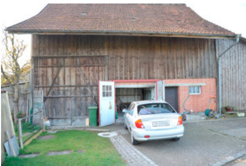
0023 Ansicht der Nordfassade