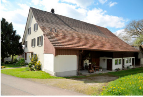
0218 Nördliche Trauffassade