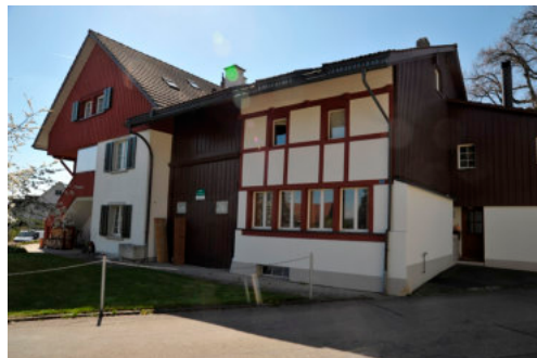
0338 Ansicht von Nordwesten