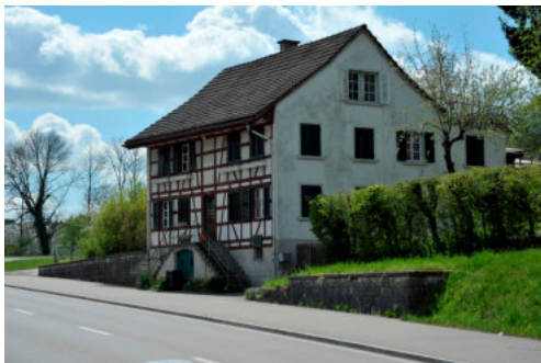
0590 Ansicht von Norden

Ehemalige Gutsverwaltung (1854) mit Wasserreservoir (1935) und Schopf (vor 1911/1929).