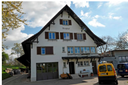
0492 Ansicht von Süden

1929-1930 erbauter Gutshofkomplex mit Wohnhaus, auch "Berghof" genannt, für die Firma Maggi. Heute als Werkhof der Gemeinde Lindau benutzt.