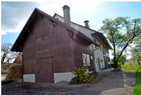
0533 Ansicht von Nordwesten.