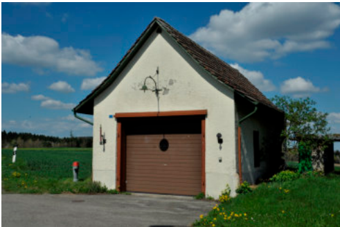
0295 Ansicht der südlichen Giebelfassade