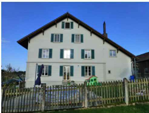
0450 Ansicht der östlichen Giebelfassade