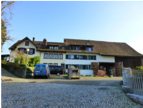
0453 Südliche Trauffassade