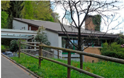
0546 Ansicht von Nordwesten