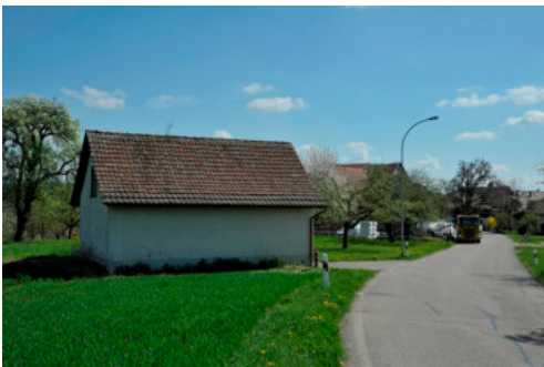
0296 Ansicht der westlichen Trauffassade

Bautyp Verkehrs- und Infrastrukturbau Bauzeit 18. Jh./1911 1911 Architekt