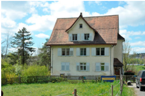
0564 Ansicht der Ostfassade