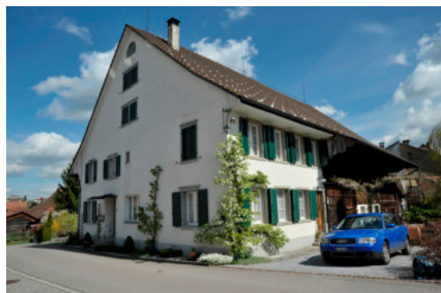
0260 Ansicht von Westen