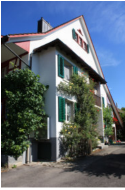
0664 Östliche Giebelfassade