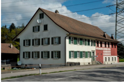
0537 Westliche Giebelfassade