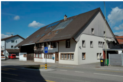
0187 Ansicht von Südosten