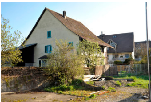
0020 Ansicht von Südwesten

Bautyp Landwirtschaftsbau - Wohnbau Bauzeit 1818 Architekt