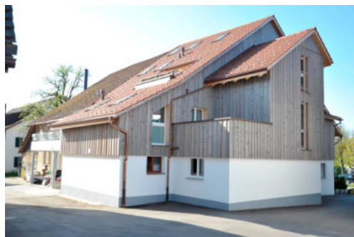
0062 Nordwest Fassade

Bautyp Landwirtschaftsbau - Wohnbau Bauzeit 17./18. Jh. Architekt