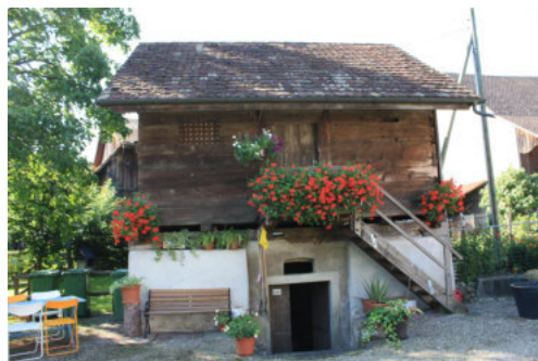
0647 Nördliche Trauffassade

Bautyp Landwirtschaftsbau Bauzeit 1790 Architekt