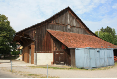
0683 Ansicht von Norden