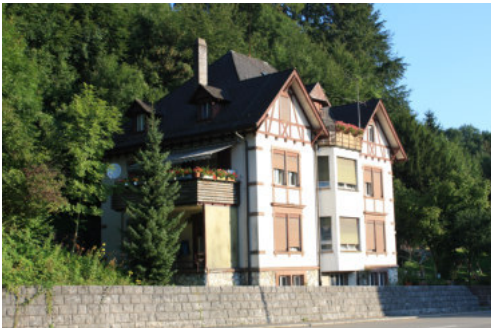
0665 Ansicht von Südosten