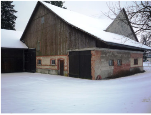
0630 Ansicht von Nordwesten