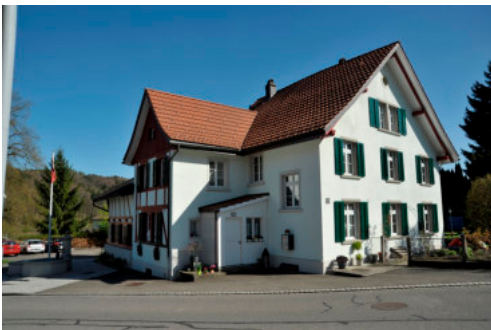
0401 Ansicht von Nordwesten