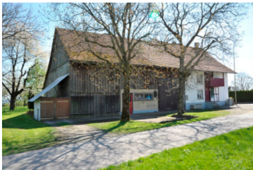
0303 Ansicht der nördlichen Trauffassade