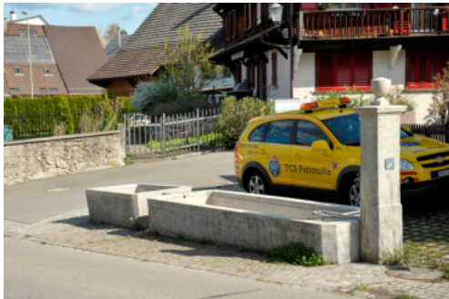
0142 Ansicht von Westen

Bautyp Verkehrs- und Infrastrukturbau Bauzeit 1839 Architekt