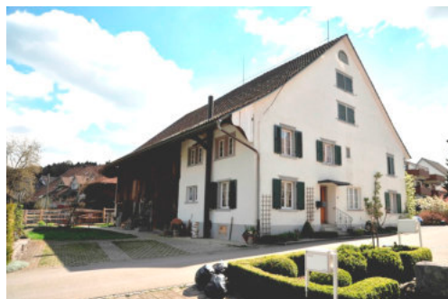
0257 Ansicht von Nordwesten

Bautyp Landwirtschaftsbau - Wohnbau Bauzeit 1743 i 1871/76 Architekt