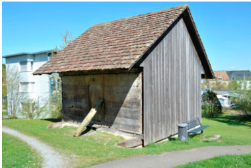
0355 Südwestliche Ansicht

Bautyp Landwirtschaftsbau Bauzeit 1582 Architekt