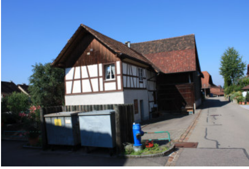
0650 Ansicht von Osten