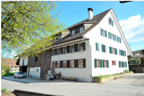
0147 Ansicht von Südwesten