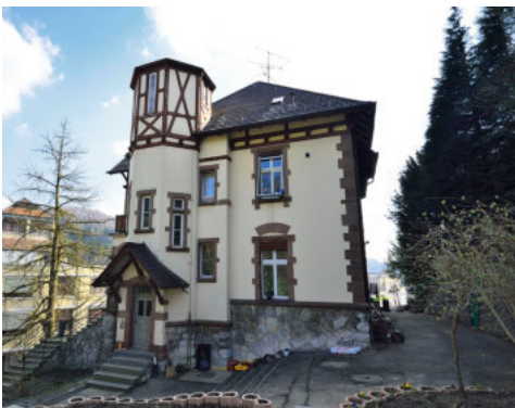
0688 Ansicht von Norden

Die Direktorenvilla Hofmann ist ein in Form und Detail differenziert gestalteter Jugendstil-Bau mit den typischen Gestaltungselementen aus der Jahrhundertwende. Mit seiner Situierung am östlichen Steilhang und dem direkten Bezug zum Fabrikareal ist die Verbundenheit bis heute ablesbar. Der ursprünglich im englischen Stil gestaltete Landschaftsgarten mit dem Gartenhäuschen (Vers. Nr. 1182) ist für die Gemeinde Lindau ein einzigartiges Ensemble.