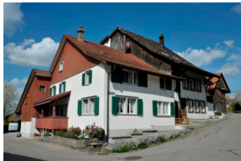
0205 Ansicht von Süden