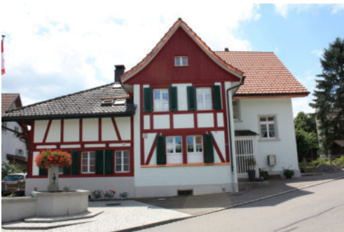
0676 Ansicht von Norden

Bautyp Wohnbau Bauzeit vor 1812 1925 Architekt