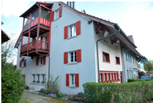
0119 Ansicht der Westfassade

Bautyp Landwirtschaftsbau - Wohnbau Bauzeit 1652, 1687 19. Jh. Architekt