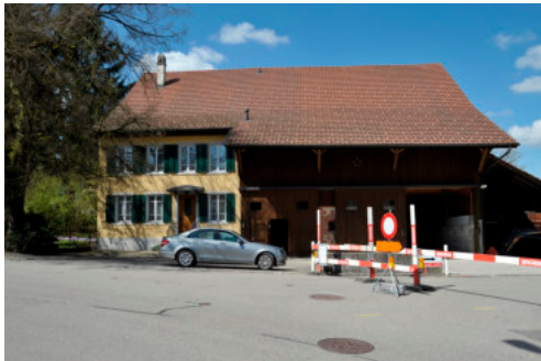
0286 Südöstliche Trauffassade