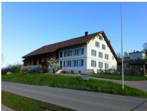
0449 Ansicht von Süden