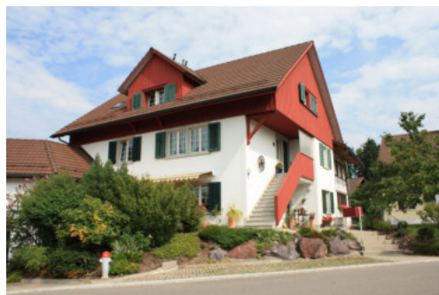
0687 Ansicht von Südosten

Bautyp Wohnbau Bauzeit 18. Jh. 20. Jh. Architekt