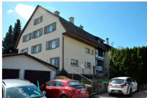
0289 Ansicht von Nordosten