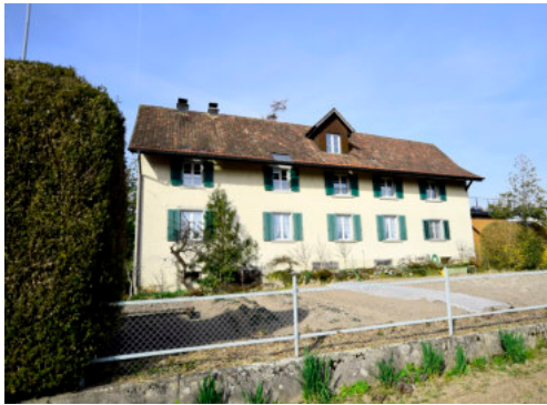
0699 Ansicht der Südfassade