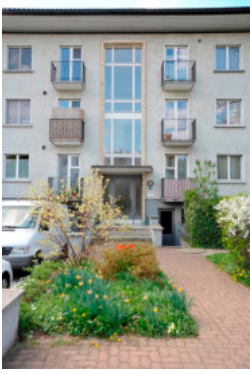
0554 Detail nordöstliche Fassade