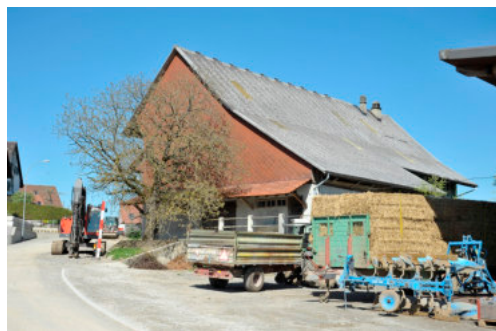
0354 Ansicht von Süden

Bautyp Landwirtschaftsbau - Wohnbau Bauzeit 1823 1876 Architekt