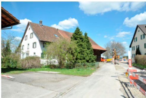
0280 Ansicht von Süden

Bautyp Landwirtschaftsbau - Wohnbau Bauzeit 1868 Architekt