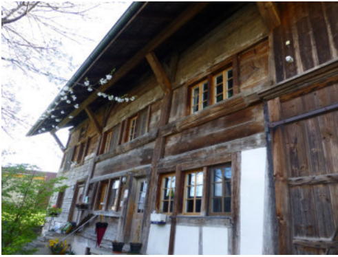
0476 Nördliche Wohnteilfassade