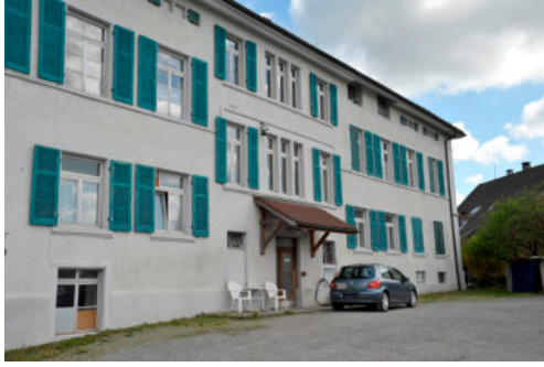
0548 Ansicht der Südfassade