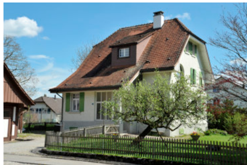
0274 Ansicht der östlichen Trauffassade