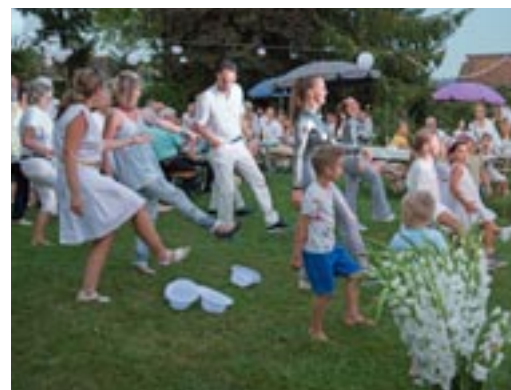
Bewegung und Spass an einem lauen Sommerabend

Nach einem feinen Imbiss folgte das Konzert der Band SLIQUE, die bereits den Gottesdienst begleitet hatte. Die Band zog das Publikum sofort in ihren Bann und nach wenigen Minuten füllte sich der Platz vor der Bühne schnell mit Tänzerinnen und Tänzern. Die