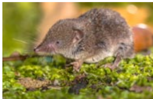
Spitzmäuse besitzen einen langen, beweglichen Rüssel.

wohner ist, so wichtig ist die Rolle der Mäuse in der Natur. Viele Tiere wie Wiesel, Füchse und Greifvögel sind von den Mäusen als Hauptnahrung abhängig. Schleiereulen beispielsweise verzichten in mageren Mäusejahren auf eine Brut; sie könnten ihren Jungen zu wenig Nahrung ins Nest bringen.