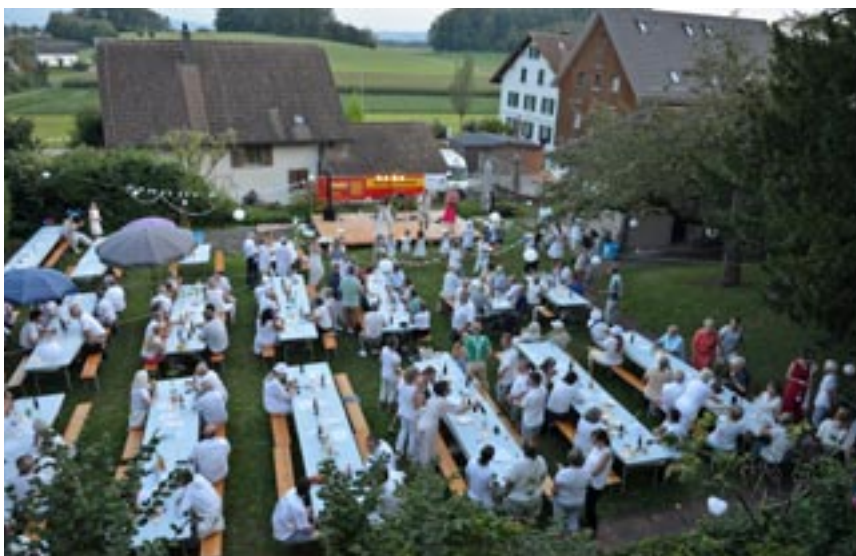
Festliche Stimmung im Pfarrhausgarten

Am 24. August feierte unsere Kirchgemeinde das Jubiläum «250 Jahre Pfarrhaus Lindau» mit einem Fest, wie es das im Pfarrhausgarten wohl noch nie gegeben hat. Gemäss dem Motto «White Party» war