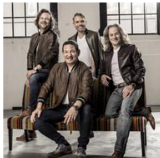
Werden Adventsgefühle wecken: I Quattro

Sie sind ein fester Bestandteil der Schweizer Musikszene und besetzen das Genre der modernen Populärklassik souverän. Seit über 12 Jahren präsentieren die vier Künstler mit viel Freude, Schalk und Können Evergreens, Popsongs, Schlager, Liedgut, Filmklassiker sowie Werke aus Operette und Oper. Ihre Konzerte und die überaus erfolgreichen Weihnachtstourneen sind meist ausverkauft. Bei I Quattro haben bereits über 200'000 Konzertbesucher hochkarätige Musik genossen. Egal ob Konzertsaal, Kirche, Firmenanlass oder Gala; es wird gesungen und gelacht, denn der Humor steht ihnen ins Gesicht geschrieben. Und dass bei den emotionalen Momenten das eine oder andere Tränchen über die Wangen rollt, ist durchaus Programm. I Quattro sind aus der Mitte des Lebens und das Entertainmentzertifikat für ein begeistertes Publikum.