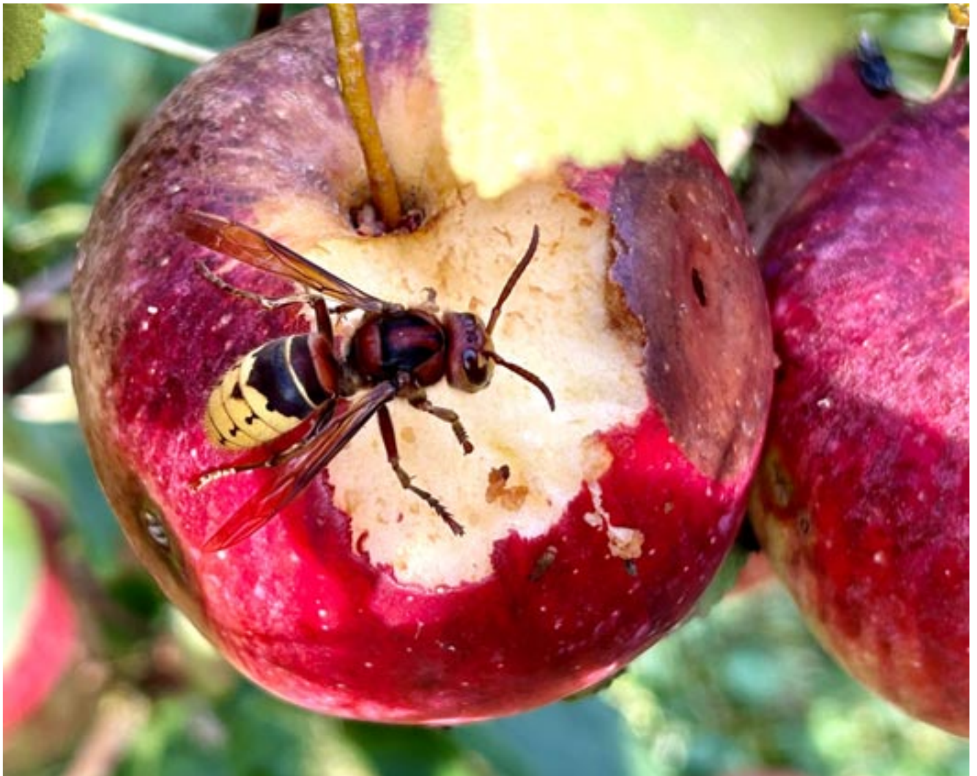
Schlemmen in den herbstlichen Leckereien.