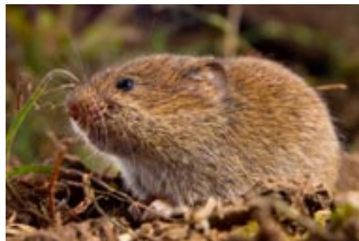
Wühlmäuse wie diese Feldmaus zeichnen sich durch einen gedrungenen Körperbau, einen kurzen Schwanz sowie kleine Augen und Ohren aus – Anpassungen an ihre unterirdische Lebensweise.

Im Gegensatz zu den Wühlmäusen leben die meisten Langschwanzmäuse oberirdisch, so auch die Hausmaus. Seit Menschengedenken haust sie unter einem Dach mit uns. Im Herbst dringen manchmal auch Waldmäuse in ein Haus ein, um sich für die kalte Jahreszeit gemütlich einzurichten. Wer könnte es den Mäusen verdenken? So viel Futter auf kleinem Raum ist hier zu finden – ein wahres Schlaraffenland. Doch so gross der Ärger der zweibeinigen Hausbe-