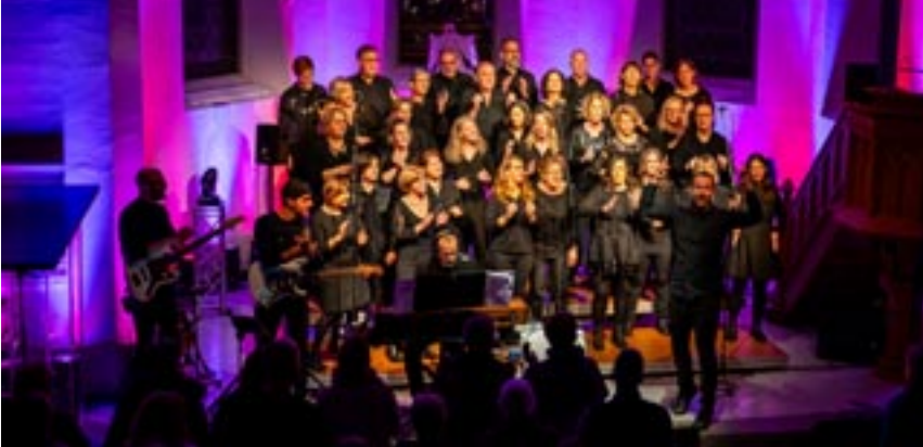
Holen Sie sich Ihren unvergesslichen Moment ab.