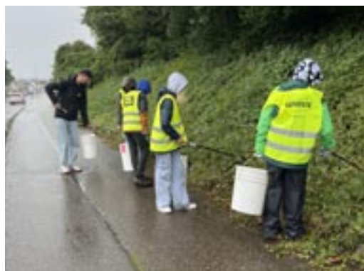
Die Jugendlichen helfen, unsere Gemeinde sauber zu halten.

Nach den Sommerferien hat die AJUGA ein neues Projekt ins Leben gerufen: